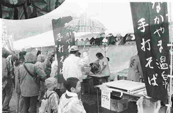
両日行われた大山山麓物産市