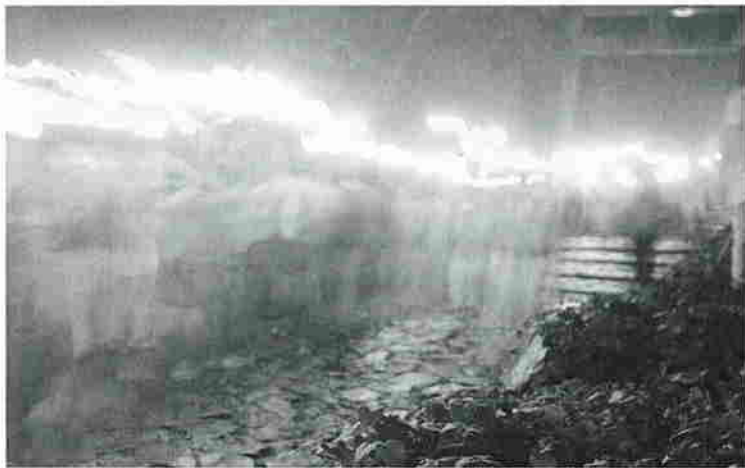
幻想的なたいまつ行列

6月4日(土)の前夜祭は、大神山神社での安全祈願神事とたいまつ行列が行われました。たいまつ行列が出発するころの大神山神社はすっかり霧に包まれましたが