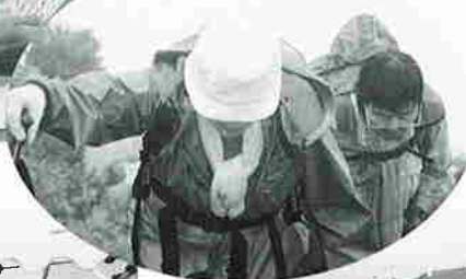
◀あいにくの雨にもかかわらず頂上を目指す登山者

6月5日(日)は大山山頂で神事が行われました。山頂では雨にもかかわらず、約2000人の登山者が夏山登山の安全を祈願しました。