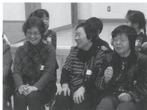
▶「わらべうた」肩たたきのうたと一緒に

ことぶき学級の皆さんの心も顔もすっかりほころんで、遊戯室は笑顔と笑い声に包まれました。