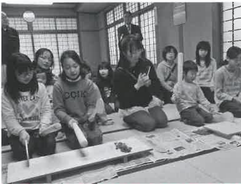
▶すりこぎとしゃもじでたたきながら歌います