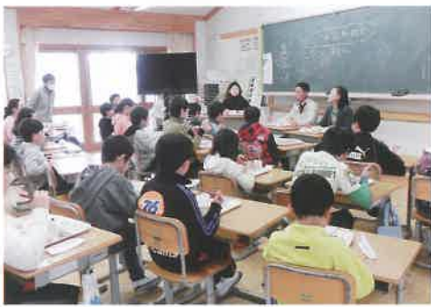
▲名和小学校での交流給食