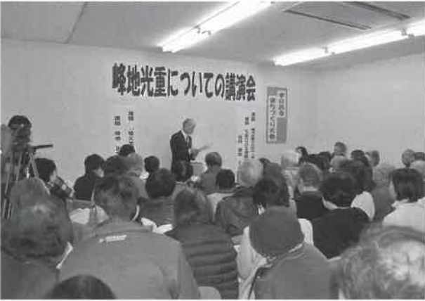
▲会場があふれかえるほどの大盛況でした