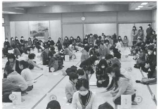
▲過去最高の30チームが参加した百人一首大会