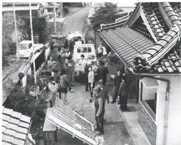
▲1回目の体験企画には、10代から60代の約30人が集まりました！