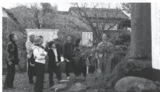
▲修学旅行（H.26 因幡万葉歴史館ほか）