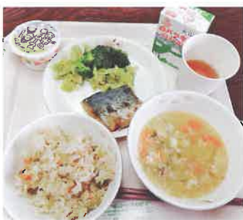
▲どんどろけめしは子どもたちにも好評です

2月1日に行われた生涯学習大会は、終日にぎわいました。お昼には学校給食が提供されるので、こちらも楽しみにされている方が多く、大盛況。ごはんは、県中部から東部にかけて食される郷土料理の「どんどろけめし」でした。「どんどろけ」は方言で、雷のこと。油で炒めた豆腐が入っている炊き込みご飯で、豆腐を炒める時に聞こえる「バリバリ」という音が雷のようだと、この名がついているのだそうです。 怖そうなネーミングですが、おいしい炊き込みごはんなので、ぜひ、ご家庭の食卓にも登場させて話題にしてください。郷土料理に関心を持つことも、生涯学習になるのかも。(ひろ)