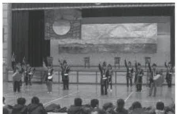
▶名和小学校でエイサーを披露