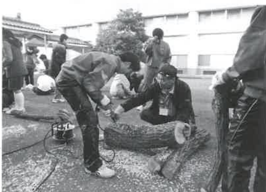
▶中学生が植菌作業を体験

生徒たちは「はじめて知ることもあり、勉強になった」「植菌体験は大変だったが、収穫が楽しみ」と興味深そうでした。