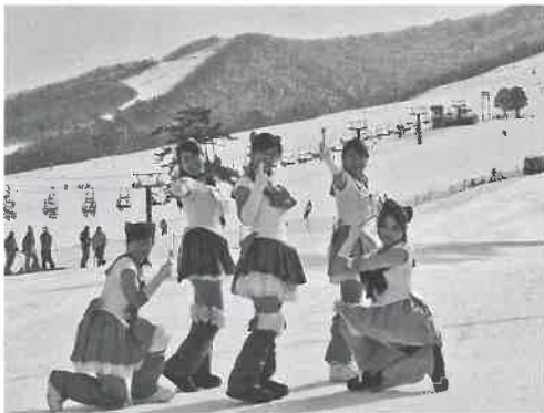
▶準グランプリの「☆美女戦士大阪ムーミン☆」

「第14回仮装して滑走大会」が、1月25日（日）にだいせんホワイトリゾート中の原エリアで行われました。