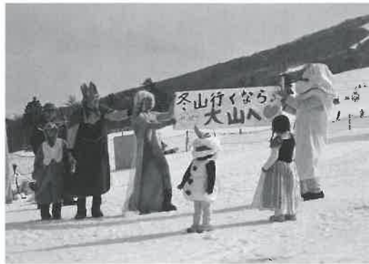
▶グランプリの「トレーシング」