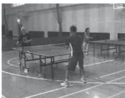
▲ラージボール卓球のようす