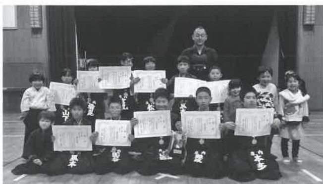
▶賞状を手にする庄内道場のみなさん

県体育協会主催の青少年剣道大会が1月25日（日）、県立武道館（米子市）で行われました。団体戦では、高学年の部に出場した庄内道場が優勝し、2年ぶり2度目の栄冠を手に入れました。また、低学年の部でも、初の3位入賞を果たしました。