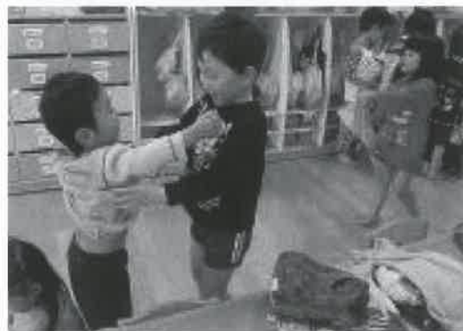
▶「おにいちゃん、今日もありがとう」

みんなが一つになりました。縦割りグループでの活動だけでなく、入園当初から5歳児が3歳児と一緒に遊んだり体操をしたりと、異年齢で一緒に過ごす活動もたくさん取り入れてきました。