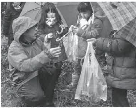
▶それぞれが混じる中、頑張りました

最後に地域のボランティアの方が七草粥を作ってくださいました。参加者全員でいただきました。