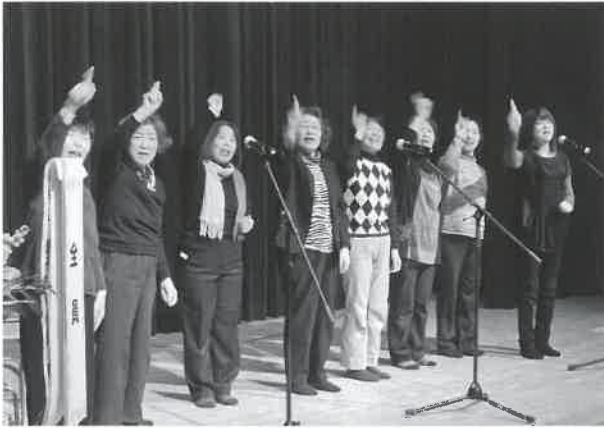
▲読書ボランティアのみなさんによるわらべうた