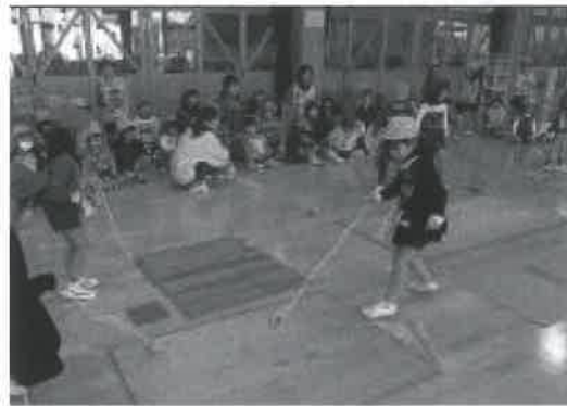
▶「コマよ、うまくまわれ」

お正月大会でも、グループ対抗でお正月遊びを競い合いました。特にコマ回しでは、仲間の大声援を受け、自分のため、チームのために頑張