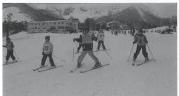
▲「八の字のままがんばってー」

なった酪農体験では、町内の酪農家「ファーム山下」を訪問し、牛へのエサやりや子牛への授乳を体験しました。牛を実際に触った子どもたちは、「大きくなってびっくりした」「たくさん飼われていてすごいと思った」など、大山町内の産業の一つを体感しました。