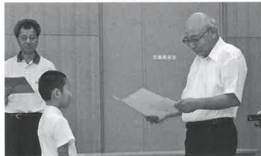
◀ 8月30日表彰式の様子