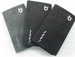
表紙カラー 黒、ワイン レッド、ブルーグレー