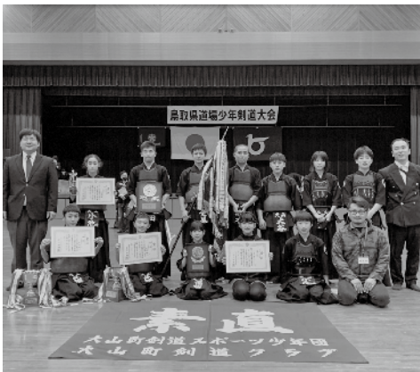
▲大山町剣道スポーツ少年団のみなさん

大山町剣道スポーツ少年団は、現在小学1年生から中学3年生までの児童・生徒23人が団員として活動しています。平成17年の団設立から、全日本剣道連盟の掲げる「剣道の理念」や団訓である「素直」の運営方針のもと、16年にわたって活動を続けてきた功績が評価されました。