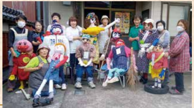
かかし作りに参加された「松河原女子会」のみなさん▶

「松河原女子会」の活動内容は固定化されておらず、毎回メンバーのアイデアで決まるそうです。何かを学ぶときは外部から講師を招くのではなく、メンバーの一人が講師となり、そのひとが得意なことをみんなで学んでいきます。これまでに手芸や書道、ハワイアンフラなどを体験してきました。また、今年4年ぶりに開催された松河原集落の運動会では集落のひとをモデルに9体のかかしを作製し披露しました。