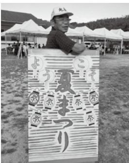
(上) 夏祭り看板 (右) アクティビティ体験の様子