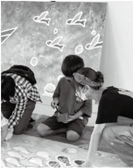
(上) イベントの様子 (右) 避難訓練の様子

ほかにも2年に一度、アーティストを招待して、アート作成イベントを開催しています。子どもたちからアイデアを募集し、地域の人たちで一体となって作成しています。