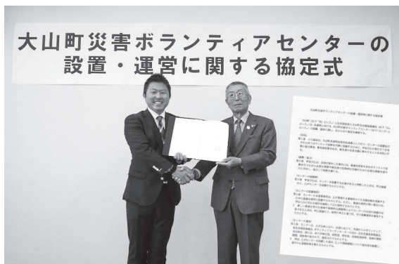
大山町災害ボランティアセンターの 設置・運営に関する協定式