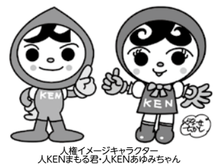
人権イメージキャラクター 人KENまる君・人KENあゆみちゃん