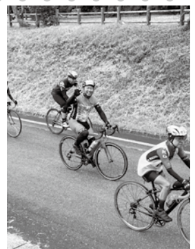
▲プレ大会でみなさんと試走

高齢者をはじめとした多くのみなさんに健康で長生きしていただけるよう、イベントを通じて活力ある長寿社会の礎を築きたいと思ひます。