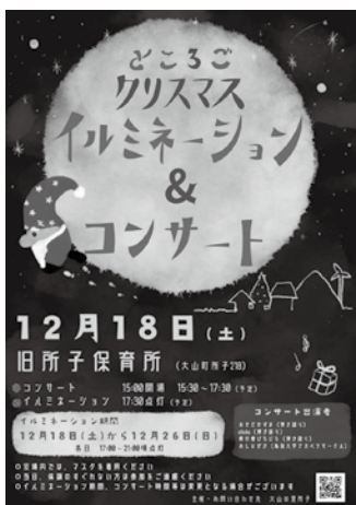
▶ 昨年も地域を盛り上げるイベントを行いました

大山の里 所子では、これまでにクリスマス・イルミネーションや音楽コンサートで、園庭や遊戯室の活用を行なってきましたが、これは組織での活用に留まらず、地域の皆さんにも利用してもらい、一緒に所子地区を盛り上げたい、という想いから、このような取り組みをスタートしたものです。