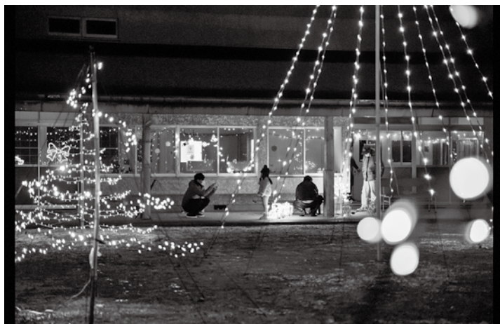
▶ 年の瀬の風物詩となったイルミネーション

先述しましたように、整備の不十分な箇所などありますが、一度施設の状態を見ていただき、お試し利用を通じて、一緒に施設の活用方法を相談させてもらいたいと考えています。興味をお持ちの方は、ぜひ一度ご連絡ください。