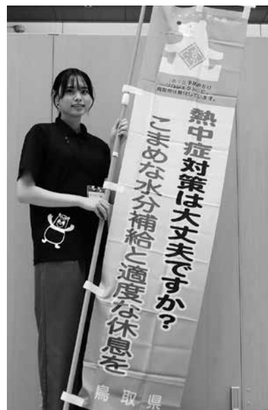
▲目印となるのぼり