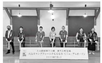
▲リニューアルオープン記念式典

昔のキャンプのイメージとは違って、新しくなった豪円山野営場をぜひご利用ください!