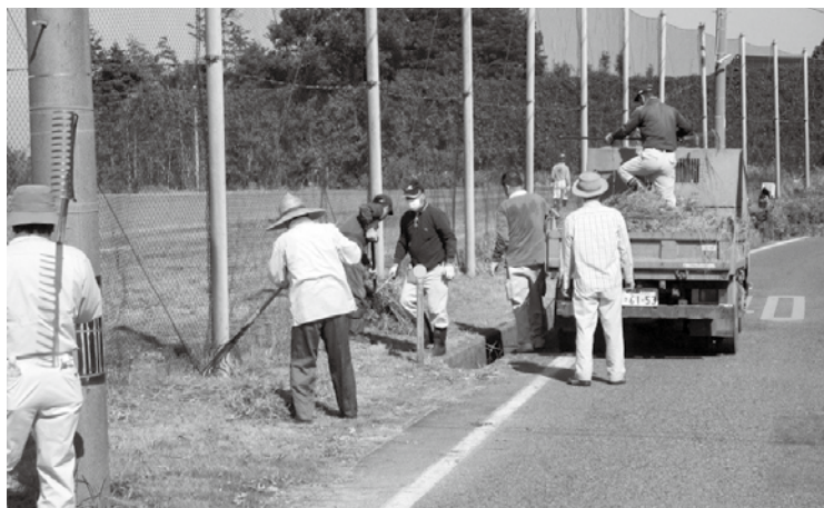
▶晴天のなか、草刈りに汗を流しました

次に②草刈り活動は、年2回計画 し、庄内地区の住民に回覧板で参加 の呼びかけを行い、住民には積極的 に参加していただくとともに、活動 に協力してもらっています。今年は 1回目として、6月に芝生の管理も 一緒に行いました。2回目は9月の 「ふるさと健康まつり」に合わせて 行う予定でしたが、新型コロナウ イルス感染症の感染拡大によ