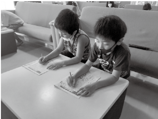
▲夏休みの宿題を片付けて