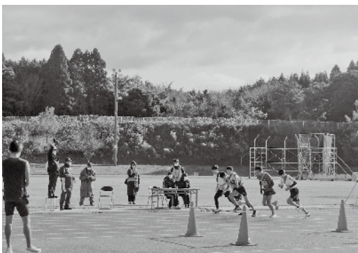
▲勢いよくスタート！