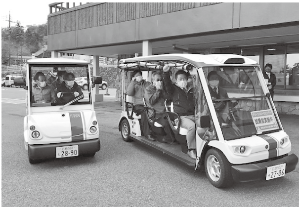
▲グリーンスローモビリティ（電動車）の実証運行

任期中は、政策の推進、役場組織の管理をはじめ、度重なる自然災害の対応など、広範囲にわたって職務を全うしてもらいました。短いようで長い4年間だったのではないのでしょうか。