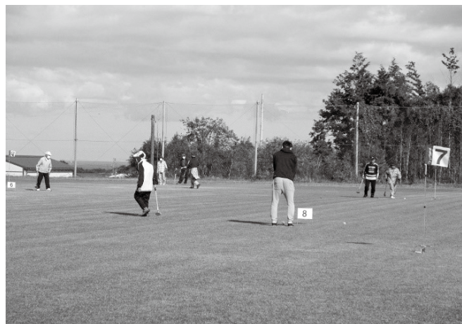
▶草刈り活動当日は晴天で、グラウンド ゴルフ大会も気持ち良く行えました

り延期し、10月に実施予定だったグ ラウンドゴルフ大会に合わせて作業 するようになりました。その後、天候 に恵まれた10月24日の日曜日にグ ラウンドゴルフ大会が行われ、草刈り 活動も無事行うことができました。