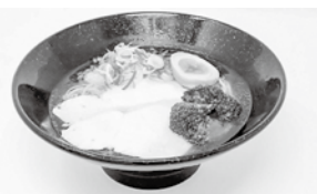
▲大山どまん中らーめん塩味

その人気の大山どまん中らーめんを毎年、新年お年玉企画、1コインで食べられる企画を行なっており、今年も1月2日より行います。まだ食べた事のない方はこの機会に食べてみてください。