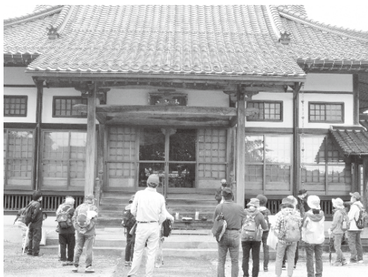
▲妙玄寺の住職の話聞く参加者

6月に大山保育所の子どもたちと一緒に植えたサツマイモ。子どもたちが水やりをしながら「大きくなあれ」と育てました。10月、待ちに待った収穫のとき、力を込めて引き抜くと、次々と大きく育ったサツマイモが出てきます。まちづくりのメンバーが見守るなか、子どもたちは泥だらけになりながら、「とれたよ〜！」「見てみて、いっぱいだよ〜！」と大興奮。見る間にコンテナがいっぱいになりました。