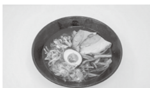
▲大山どまん中らーめん醤油味