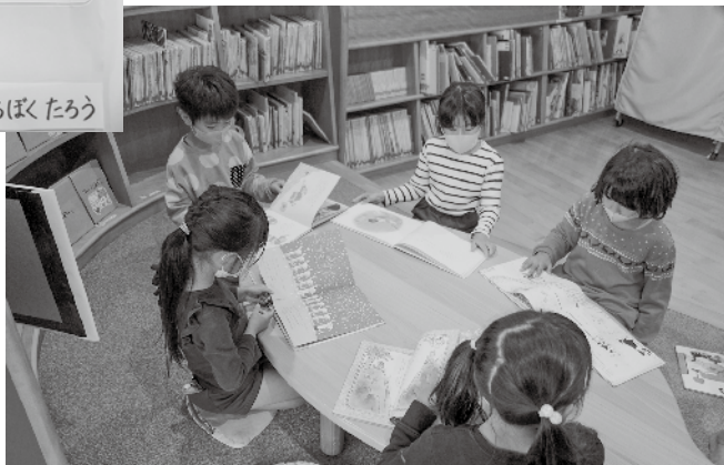
▲「おもしろそう。今日はこれ借りようかな〜」