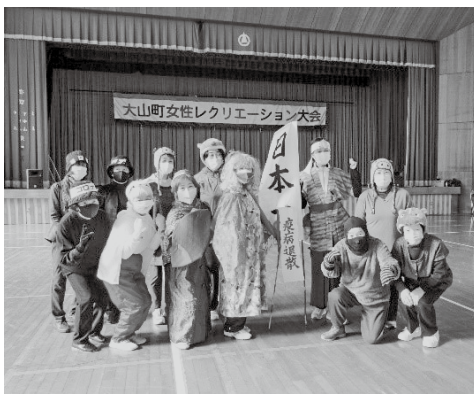
▲桃太郎とアマビエ一行がコロナをやっつけます

パン食い競争、玉入れなどのおなじみの競技のあとは、今回の目玉プログラム「お話玉手箱」です。各地区でテーマに沿った仮装をし、パレードで会場を盛り上げました。寒い時期でしたが、体育館の中は参加者の熱気でいっぱいになりました。