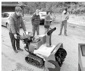
▲雪が降っても大丈夫