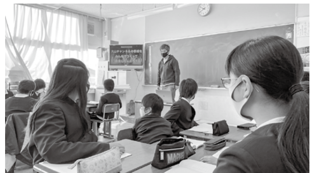
▲中山小の児童たちが番組づくりに挑戦！

年末年始の話題に加え、中山小の児童が自ら企画し、自ら撮影した「中山小のヒミツ」など、よりパワーアップした住民参加コーナーもお楽しみに！