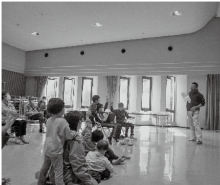
▲「はい、正解だったよ！」

ゲーム感覚で、センター内に隠された10個の防災クイズを探して解く、新聞紙でスリッパを作るなどの3つのミッションをこなしました。参加者からは「クイズ見つけたよー！」「どこどこ？」と賑やかな声飛び交い、楽しく遊びながら防災について学ぶことができました。