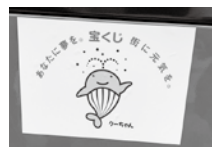
▶宝くじマスコット「クーちゃん」

これにより富長東自治会では、皆で協力して除雪しよう」と、集落内の除雪の出動態勢を整えました。