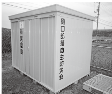
▲樋口集会所横に設置された防災倉庫

整備された資機材により、災害被害の最小化と、住民の防災意識のいっそうの高まりが期待されます。