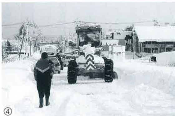
④ 復旧にむけた除雪作業の様子 （1月1日・塩津交差点付近）