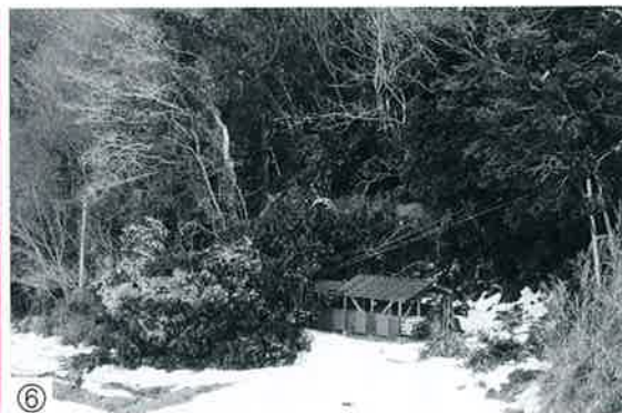
⑥ 雪による倒木でDネット、NTTケーブルが断線するなどの被害報告が次々と寄せられた。（豊成地区）