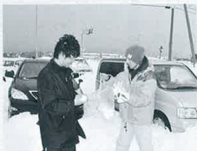
おにぎりを受け取るドライバー

昨年の大晦日に、私どもの乗った観光バスが大雪で立ち往生し、20時間もの間、食事もとれず不安と憔悴で元日を迎えました。が、岡地区の皆様のご厚意により、公民館で足を伸ばして休ませていただいたうえ、手作りのおにぎりや天ぷら、お味噌汁などごちそうになり、心温まるお氣遣いを頂戴いたしました。厚く御礼申し上げます。元日の貴重な団欒のひとときのお時間にもかかわらず、私どものために誠にありがとうございました。 また、中山支所の職員の方々には毛布をお借りして一晩お世話になり、御礼も申し上げぬまま帰路につきましたことをお詫び申し上げますと同時に心より感謝申し上げます。このたびの豪雪は、大変な災害であったと大晦日のバスの中