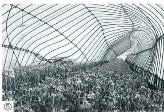
⑤ 雪の重みで牛舎やビニールハウスの倒壊被害が。