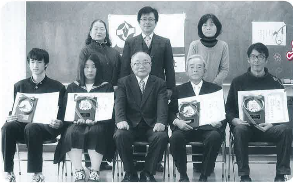
▲表彰状を手にする受賞者のみなさん