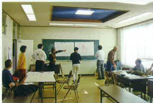
▲みんなで一緒に考えましょう

間を探しています。参加条件は「自分で何かやってみたい」という思いがあることだけ。誰でも参加いただけます。企画をしてみたい、実践してみたい、なんだか気になるという方など、たくさんの方のご参加をお待ちしております。