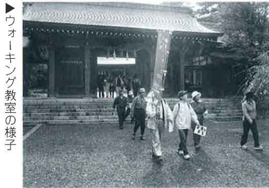
ウォーキング教室の様子