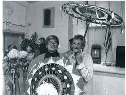
▲傘踊りを披露しました

写真を使いながら、ホストファミリーと相互理解を図ったり濃茶や薄茶をふるまったり、他の家族も交えて合同でお好み焼きパーティーを行いました。交流を深めることができました。息つく暇のないツアー、疲れましたが二度と経験できない