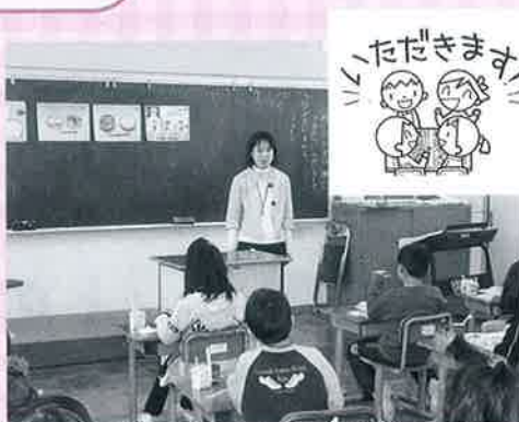
給食週間や大山おこわについて勉強中!