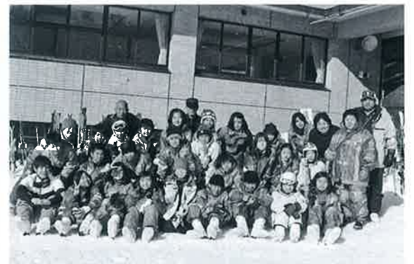
▲嘉手納町児童が待望のスキー交流

旧大山町と沖縄県嘉手納町が、ともに国体のソフトボール会場になったことが縁で毎年夏と冬に児童が相互に訪問しているこの事業。23回目の今回は、嘉手納町の児童16人(小学5年生)が2月1日から4日まで3泊4日の日程で町内を訪問し、同年の8家庭にホームステイをしながら、スキー体験や学校訪問を通して交流を深めました。