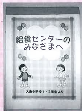
調理員さんにお手紙... 「おいしい給食をいつもありがとうございます!」