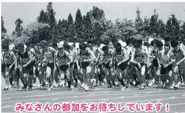
みなさんの参加をお待ちしています!

◆申込み方法 大会要項の払込取扱票に必要事項を記入し、郵便局に参加料をお支払いください。要項は町内の各施設にあります。