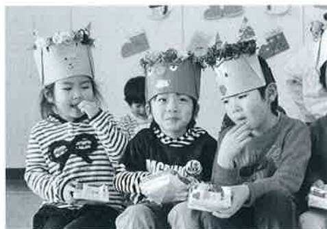
▲豆をもらって、年の数だけ食べました