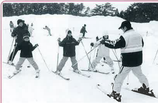
▲上手になったよ！元気な声が響きました

会場の大山青年の家には、大人の背の高さほどの雪が積もっており、参加者全員が雪の多さに歓声をあげていました。