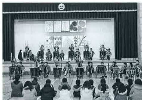
▲「響け名和太鼓」を披露(名和小)

この冬は、学校や保育所でも除雪に大変苦労しました。除雪用具が店頭で品薄になる中の寄贈に「大助かりです!ありがとうございます」と感謝の声が聞かれました。