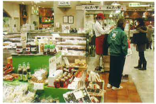
▲大山町産品をずらりと並べて

特産の大山ピーナツ・こんにゃくを始め、大山町の生産者による手作りドレッシングやジャム、漬物、お茶、海産物などを所狭しと並ばせて「道の駅米子出張所」として大山町の産品をPRしています。同時に「手づくり工房大山恵みの里」で製造したコロッケやメンチカツ、新商品の大山豚まんの実演販売も行っています。 お客さまは大山町産を強調した商品に安心とおいしさを感じてくださっている様子で「大山の食材なら安心」「こんにゃくがおいしかったからま