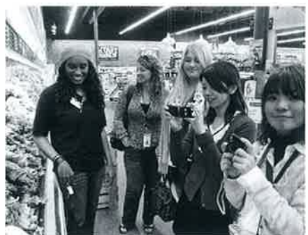
▲スーパーの野菜売り場。「量がすごい」