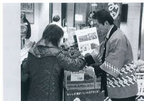
▲千里大丸プラザで試食販売

ダーに扮し、スノーボードを片手に「大山は今までにないパウダースノーで最高のコンディションとなっております。スキー場までのアクセス道路は除雪が万全。皆様のお越しをお待ちしています！」とPR。からす天狗のグーちゃんや温泉旅館の女将さんと一緒に「ぜひ鳥取県に来てください！」と観光パンフレットを手渡しました。