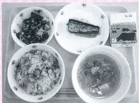
1月26日の献立 大山おこわ、かに汁など

全国学校給食週間を機会に、各学校では、給食や地元の食べ物について関心をもったり、感謝の心を育んだり、様々なことを学ぶ取り組みが行われました。