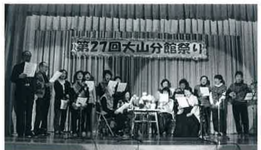
▲弥生の風歌声サロンによるコーラス披露 (大山分館まつり)