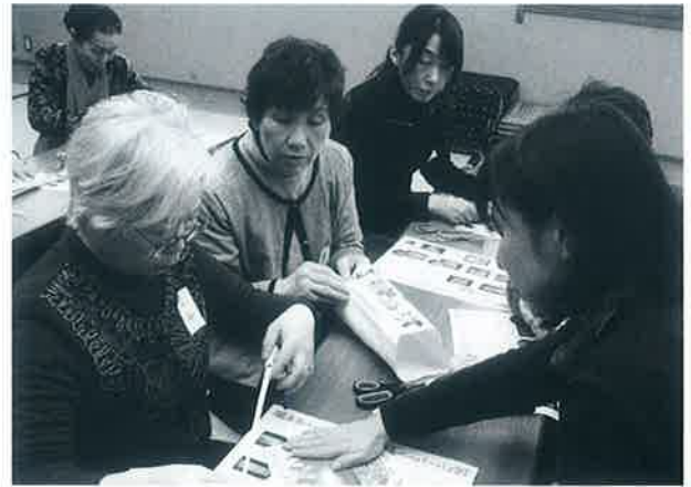
▲絵本のカバーを使って、きれいなペーパーバックを作成中

2月19日(日)、保健福祉センターだいで、大山町女性団体連絡協議会主催による平成22年度女性団体研修会が開かれ、町内の女性約100人が参加しました。同連絡協議会では、今年度「生活の中から環境を考える」を主な活動テーマとして取り組みました。そして今回の研修会でも同じテーマを掲げ、講演会、分科会、体験活動を行いました。