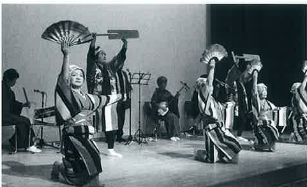
▲演奏も踊りも息びつたりの中山芸能同好会 (なかやま公民館まつり)