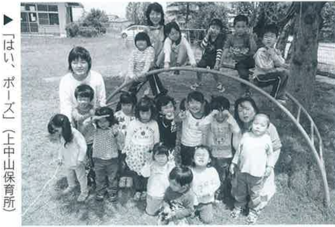
「はい、ポーズ」(上中山保育所)

この新設の保育所では、現在分散して行っている「延長」「時預かり」「乳児」の保育サービスを集約し、新たに「病後児保育」を実施します。また、子育て支援センターを併設することにより、中山地区での子育て支援の拠点となる施設として位置付けます。