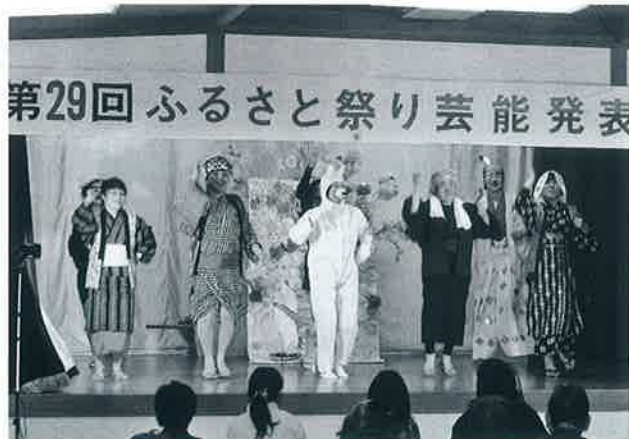
▲上方婦人会による劇「花咲かじいさん」の一場面 (こうれいふるさと祭り)

年末年始の記録的な大雪がすぎ、春が来るのが待ち遠しい中、「なかやま公民館まつり」と「こうれいふるさと祭り」が2月19日(土)・20日(日)に、大山分館まつりが3月5日(土)・6日(日)に、それぞれ盛大に開かれました。各会場では、公民館を拠点に活動されているみなさんによる作品の展示のほか、芸能発表やバザーが行われ、会場内は集まった多くのみなさんの熱気で、一足早い春が訪れたようでした。