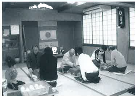
▲勝負を通して親睦も深めていました

2月11日、中山公民館将棋教室主催による新春将棋大会が行われました。会場の中山公民館には町内から幅広い年代の将棋愛好者が集まり、熱き戦いを繰り広げました。結果は次のとおりです。(敬称略)