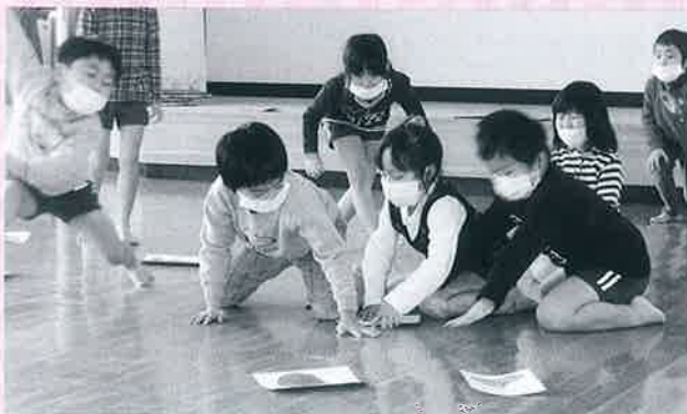
▲お正月大会で食育カルタとりを楽しみました

みんなで一生懸命工夫したカルタは、その甲斐あって絵を見ても楽しく、読んでもおもしろい「食育カルタ」に完成しました。