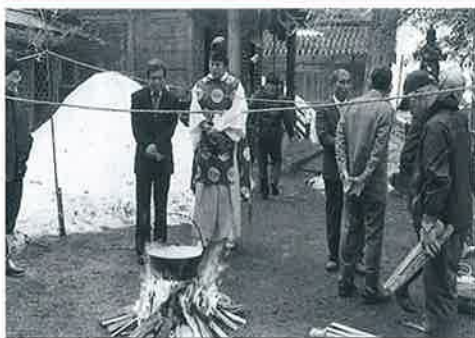
▲米と竹筒を入れ、鉄鍋で炊き上げます

米と竹筒を煮立て、筒の中に入った粥の量で、その年の農水産物の豊凶を占う「管粥神事」が営まれました。逢坂八幡神社の管粥神事は、江戸時代から約270年続く伝統行事で、県内では逢坂八幡神