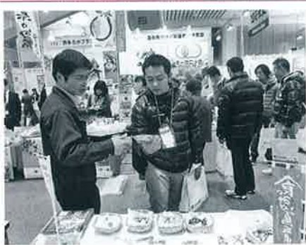
▲アグリフードEXPO2011の様子

全国から約200の農業関係者が出展し、国産農産物の展示商談会が行われました。多くのバイヤー・関係者が集まる中、大山町からは「大山