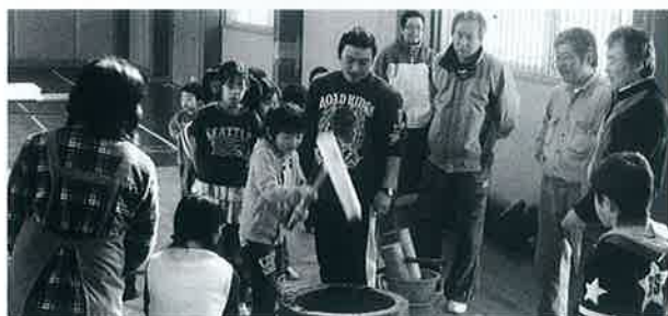
▲チビツ子の集いでの餅つき体験 (こうれいふるさと祭り)