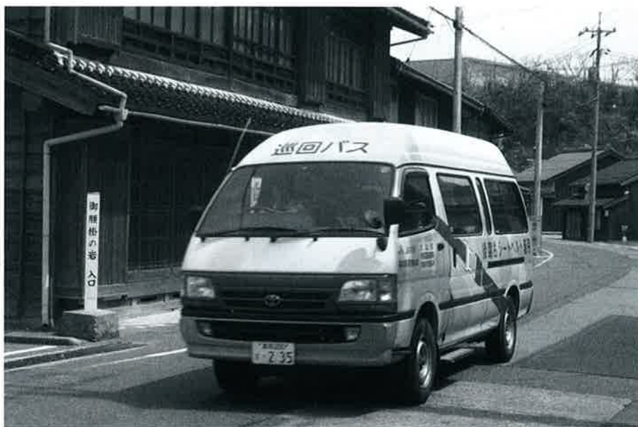
▶写真は現在運行中のバイオディーゼルのワゴン車。今後電気自動車(普通自動車)に置き換えます