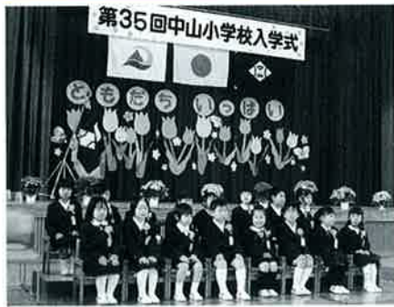
▲入学式、どきどきするね

桜の名所でもある名和公園。年末年始の豪雪の折、雪の重みで桜の枝がかなり折れてしまいました。例年より開花が遅れましたが、今年も見事に咲き、桜を見ようと次々と花見客が名和神社や名和公園を訪れました。 「桜はやつぱり、いいね」お弁当の包みを手に歩く女性グループから声が聞こえてきました。名和神社前を通る車もゆつくりと通行し、花で雪化粧したかのように見事に咲く桜のトンネルを楽しんでいるようでした。