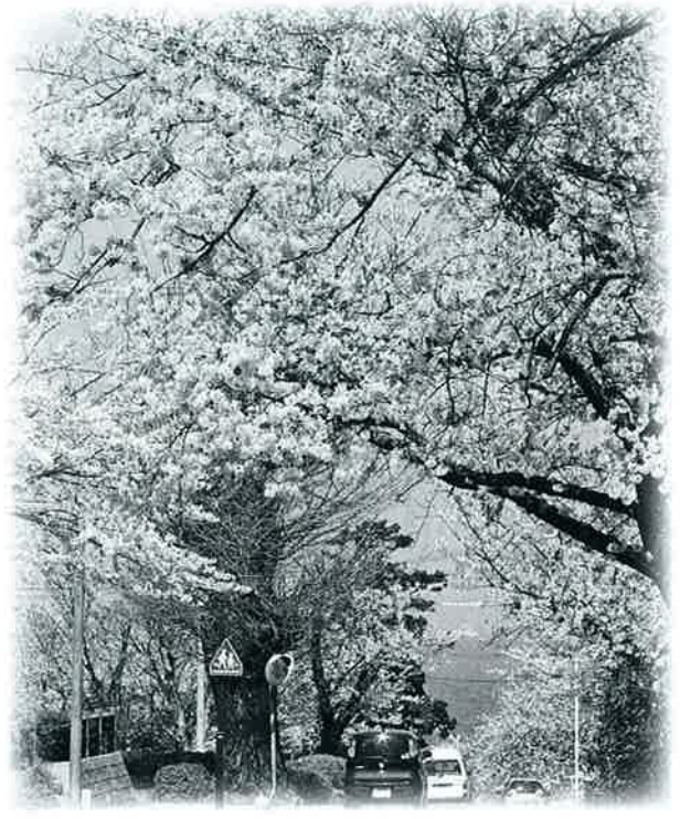
▲神社から日本海をながめると、桜の絶景が広がります

桜の名所でもある名和公園。年末年始の豪雪の折、雪の重みで桜の枝がかなり折れてしまいました。例年より開花が遅れましたが、今年も見事に咲き、桜を見ようと次々と花見客が名和神社や名和公園を訪れました。 「桜はやつぱり、いいね」お弁当の包みを手に歩く女性グループから声が聞こえてきました。名和神社前を通る車もゆつくりと通行し、花で雪化粧したかのように見事に咲く桜のトンネルを楽しんでいるようでした。