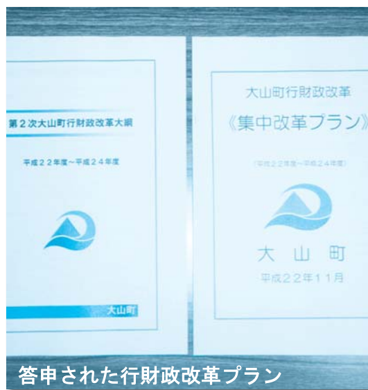
答申された行財政改革プラン

〔町長〕本町でも、この新公共経営の考えを取り入れながら、職員の意識改革やサービスの向上、人事評価制度導入、行財政改革による組織の見直し検討、指定管理制度導入などの取り組みを行っている。 しかし、地方自治法などの法令によって制約を受け、財源は国に大きく依存しており、このような