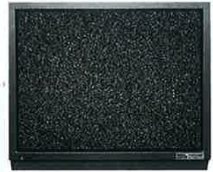
▲アナログ放送終了のテレビ画面