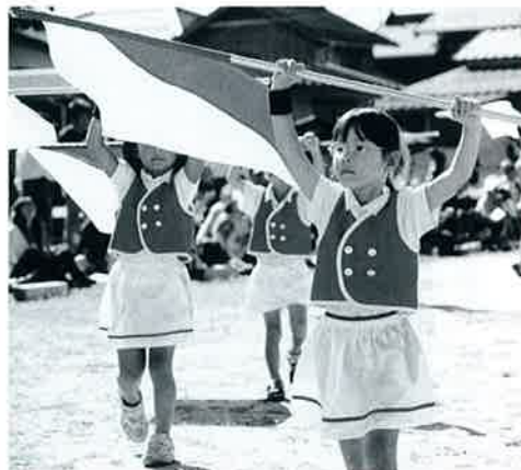
▼旗をなびかせさっそうと(フラッグ)

また年長・年中の園児は種目だけでなく、準備や片付けの役割を持って、しっかり仕事をしました。歯を食いしばって乗り越えた巧技台、悔しさであふれる涙をこらえて走りきったわが子を「よくがんばったね」と抱きしめている保護者の姿など、さまざまな感動の場面が見られた運動会でした。 今年度下中山保育所では、子どもたちの体づくりをめざして、毎朝元気にリズム運動をしています。また心を鍛える場として地域のお寺で座禅も体験しています。そうした日々の積み重ねがあらわれた運動会だったのでではないでしょうか。 運動会では順位よりも、その過程で培った協調性・頑張りぬく力、友だちを思いやる気持ちが子どもたちの成長の糧となります。その力はさまざまな場面で発揮されると信じています。