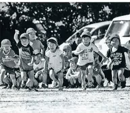
▲ゴールをめざして、よーいドン!!

真つ青に澄み渡った秋空の9月24日(土)に、下中山保育所で運動会を行いました。 オープニングは、年長組によるフラッグです。暑い夏から毎日練習を重ねてきました。年長組13人の呼吸もびったりで、子どもたちの見事な旗さばきに観客の歓声があがりました。 運動会は、それぞれの年齢にあったプログラムで展開をしていきました。食育にちなんだ種目や、子ども同士、親子、保護者同士の絆を深める内容も取り入れられました。お父さん、お母さんとスキンシップを深めた子どもたちは、照れながらも笑顔満開でした。