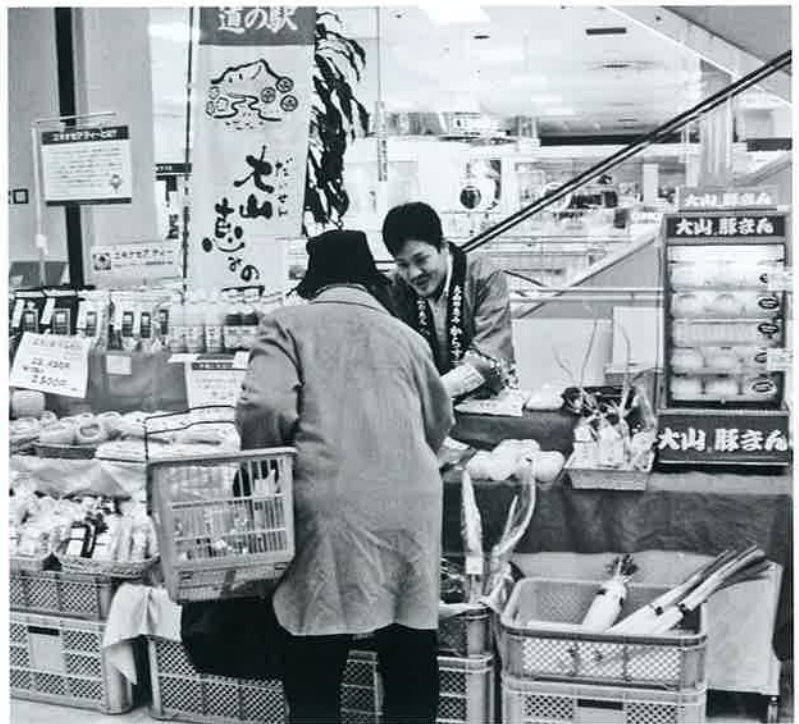
▲「今年も来たよ！」お客さまから声がかかります

12月26日～30日、米子高島屋迎春祭が催されました。大山恵みの里公社も、この催しに出店させていただきました。正月のしめ縄・新鮮野菜・漬物・王秋梨・大山そばを始め、新商品としてブレイクが期待されるエキナセアティーや、大山町農産加工場で製造した冷凍食品、大山豚まんなどをずらりと並べて販売しました。高島屋のお客さまは年末恒例となった大山恵みの里の出店を楽しみにしていただいている方が多く、「今年も来たよ」と多くのリピーターの方で賑わいました。このような定期的なイベントへの出店で大山町の商品が認知され、店舗での常設商品として扱っていただけるものが増えてきました。認知度が