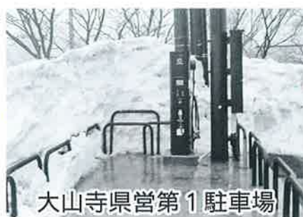
大山寺県営第1駐車場