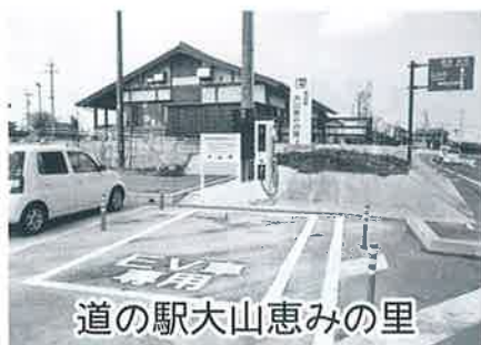
道の駅大山恵みの里

このほか、役場本庁、中山支所、大山支所、人権交流センター、中山タクシー、日興タクシー、日交バス佐摩車庫に200V普通充電設備も併せて設置しました。この設備も無料でご利用いただけますが、施設の開庁時間等に限り、ご利用の際は、各施設にお尋ねください。