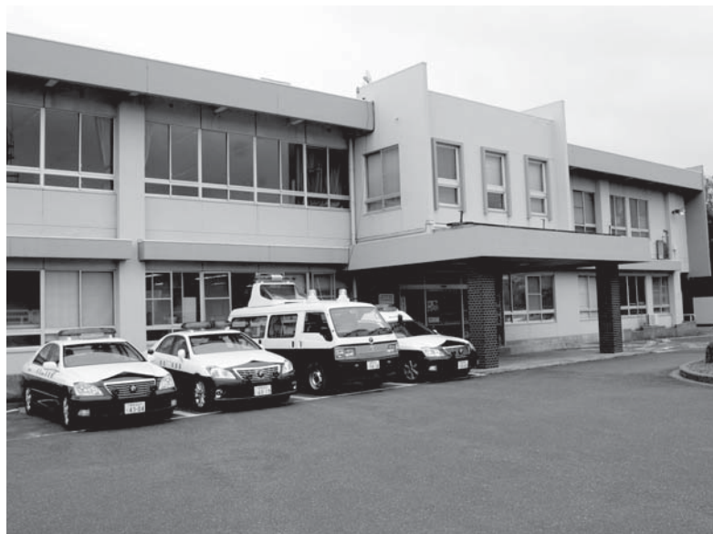
移転が予定されている八橋警察署

【米本】八橋警察署の移転という言葉を聞くようになった。大山地区から現在の八橋警察署までは相当時間がかかる。交通や利便性を考え、もし、移転となれば、管轄地域の中心ありの本町に、警察署の誘致ができないか。