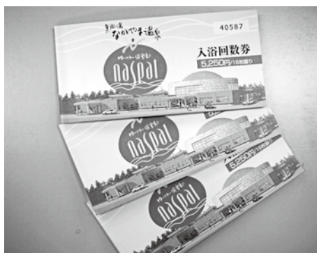
なかがま温泉の入浴券