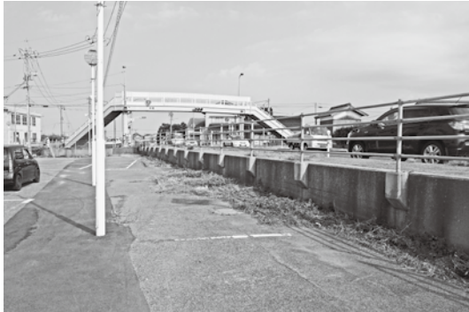
国道9号線の拡幅(塩津交差点)

もすすめてはどうか。この事業のねらいは人口増のほう。町独自ではむずかしい。相談者からは、外国人でもよいとは聞いていない。