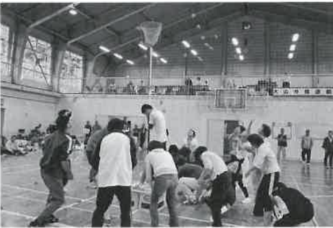
▲よーくねらって（大山地区）