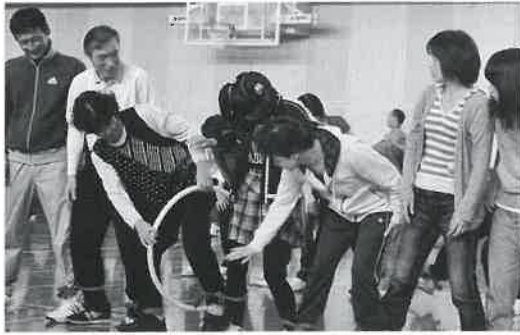
▲そこ、足上げて！（光徳地区）