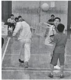
▲パッチリキャッチ（庄内地区）