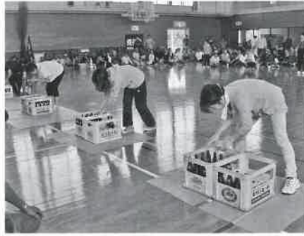
▲いそいでいそいで（逢坂地区）