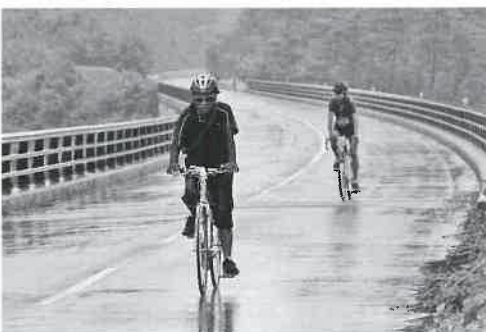
▲雨の中、チェックポイントへ

開会式直前に雨が上がり、晴れ間も出て無事にスタートしたものの、再び激しい豪雨に見舞われるというハプニングが。大粒の雨にぬれながらも、参加者は懸命にゴールを目指してペダルをこぎ続けました。 サイクリングのあとは、雨で冷えた体を中山温泉で、温まっていただき、「焼肉」と「お楽しみ抽選会」を楽しみました。 延々続く登り坂とおいしい焼肉が名物となっているこの大会、悪天候にはなりませんが、和気あいあいとたくさん笑顔が広がっていました。