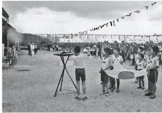
▶開会式で聖火台に点火 （高麗地区）

9月下旬から10月上旬にかけて、町内各地区で町民運動会が行われました。雨のため、屋内会場での開催となった地区もあったものの、どの会場にも参加者の笑顔があふれていました。