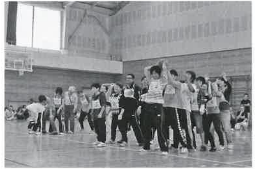
▲おとさんようにね！（下中山地区）