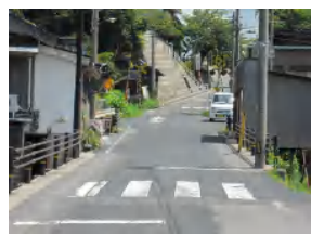
＜対策メニュー＞ 減速マーク【鳥取県】