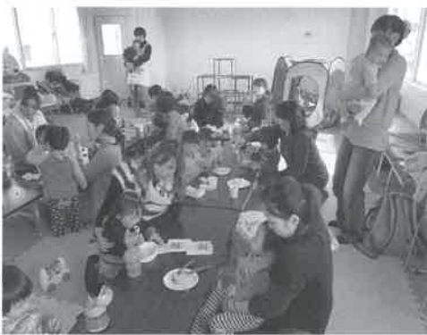
▶お茶会を楽しみました（名和ふれあいサークル）

子育て支援センターにはいろいろな世代の方が参加してくださるので、よい影響が生まれています。子育ては一人ではできません。いろいろな人の力を借りながら、地域の仲間と一緒に子育てを楽しみましょう。