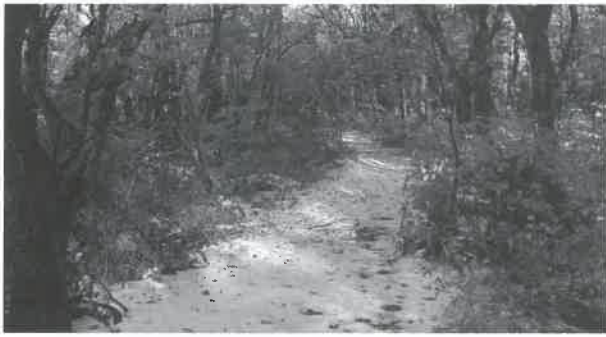
▲姿を現した坊領道古道

大山参りの人々が行き交った大山道には、横手道、川床道、尾高道、坊領道（御来屋道）、溝口道の5幹線があります。「歴史の道百選」（文化庁）に選定されている横手道・川床道は、ハイキングコースとしても利用されていますが、大部分が舗装道路となつた坊領道などでは、残された古道の部分は、藪になつて道筋も分からなくなりつつあります。