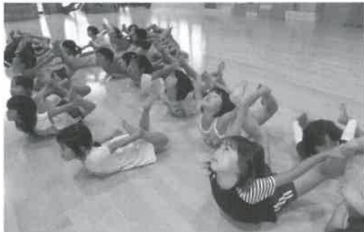
▲「カメ」のリズム運動(もしもし亀よの歌に合わせて)

中でもリズム運動は昨年から本格的に取り組んでいます。毎朝3歳児から5歳児が遊戯室に集まり、体操やマラソンの後、ピアノに合わせてメダカ、カメ、三輪車、両生類のハイハイ、ギャロップ、汽車など、さまざまな形を体で表現しながら、日常生活では使わない筋肉も使います。また、子ども同士が励まし合