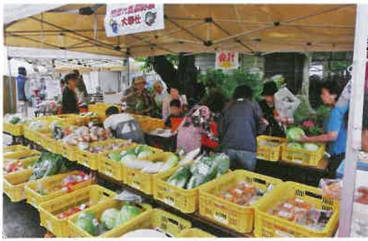
▲とれたて野菜がずらりとならんだ収穫祭

「地元野菜が新鮮で安い」とお客さまに評判のみくりや市。日ごろの感謝を込めて店外テントでの青果やソフトクリュームの販売を行い、ポン菓子やプレゼントや、ガラポンを楽しんでいただきました。