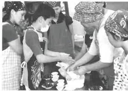
▲「できたての生地は熱いから、気をつけて」