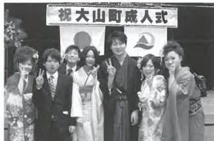
▲平成25年成人式実行委員の皆さん