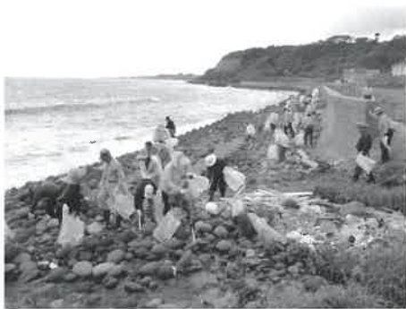
▲昨年の海岸清掃の様子

まちづくり庄内地区会議では、昨年引き続き、庄内地区の海岸(富長海岸と大雀海岸)の一斉清掃を行います。清掃活動をしながら、地域環境の美化意識やボランティア意識の高揚を図るとともに、交流を深めていこうと計画をしました。 多くの方に参加していただきますようお願いいたします。