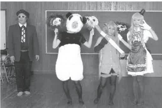
▲かあら山(旧高麗保育所)にぜひご来館を!