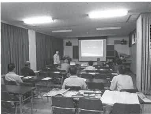
▲報告会の様子(名和公民館)

「英語が上手に話せなくても、交流をしようとする気持ちがあれば大丈夫」「学校や子育ての違いを知って、自分は何ができるかを考えるようになった」など、テメキュラで経験してきた交流の成果を伝えることができました。