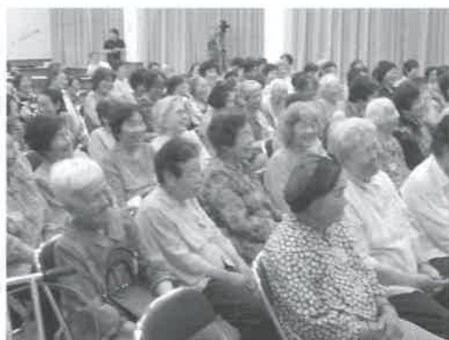
▶講師の巧みな話術に笑顔が絶えない参加者のみなさん