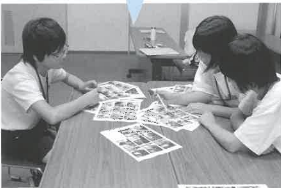
自分たちが撮影してきた写真をチェックします