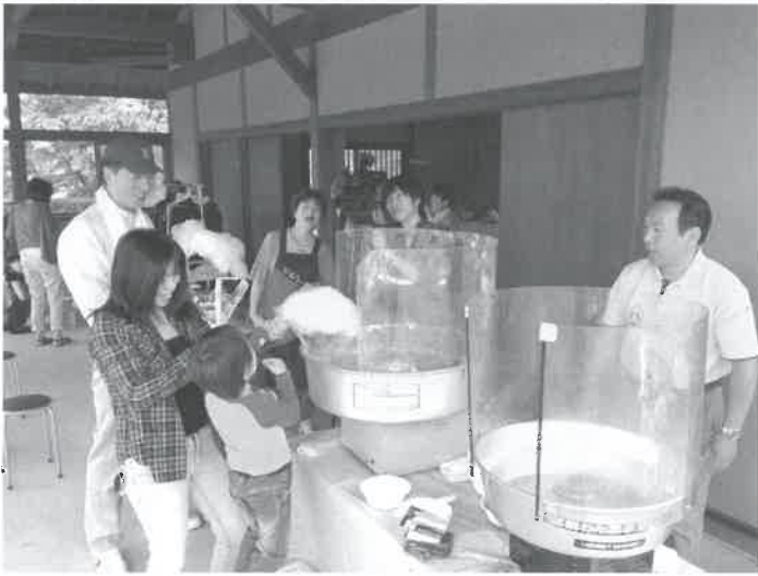
▲わたがし、うまく作れるかな?

仁王堂公園では、毎週日曜日、坊領婦人会の 皆さんが、駐車場入り口の建屋で、朝8時から 野菜の朝市を開いています。フリーマーケット