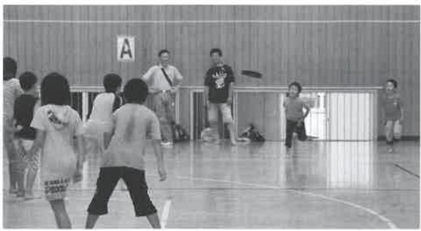
▲新種目ドッジビー