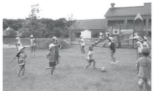
▲竹馬やサッカーあそびは楽しいよ!(芝生の園庭で)