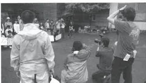
▲大山ものづくり学校前で