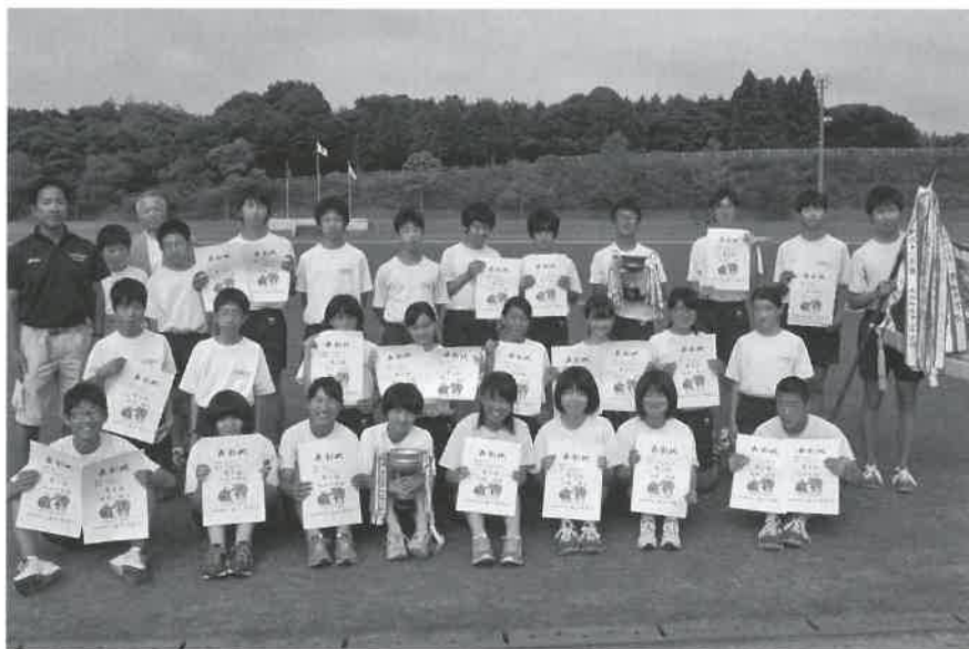
▲中学校総合優勝の大山中

る大会となりました。大山町は、一般の部をはじめ、中学校の部で大山中学校が見事総合優勝を飾りました。100m走、400mリレー、走り高跳びなど個人・団体での活躍が光りました。郡民体育大会各競技に大山町代表として参加された選手のみなさんお疲れさまでした。