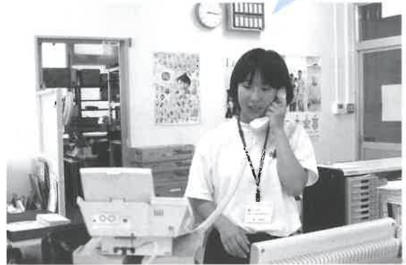
取材の申込みの電話をかけました