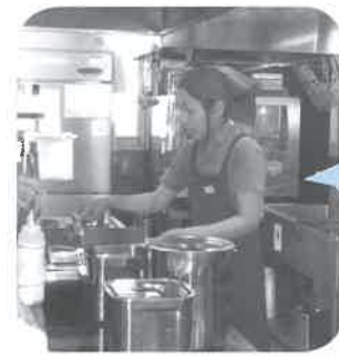
道の駅大山恵みの里