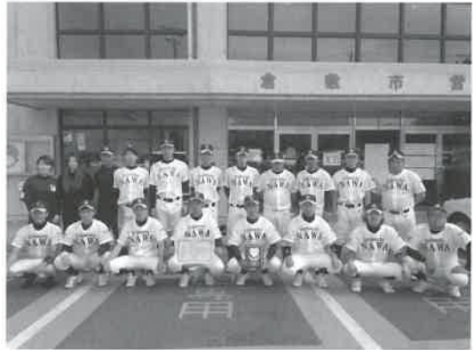
▲大山町体育協会野球部名和の皆さん