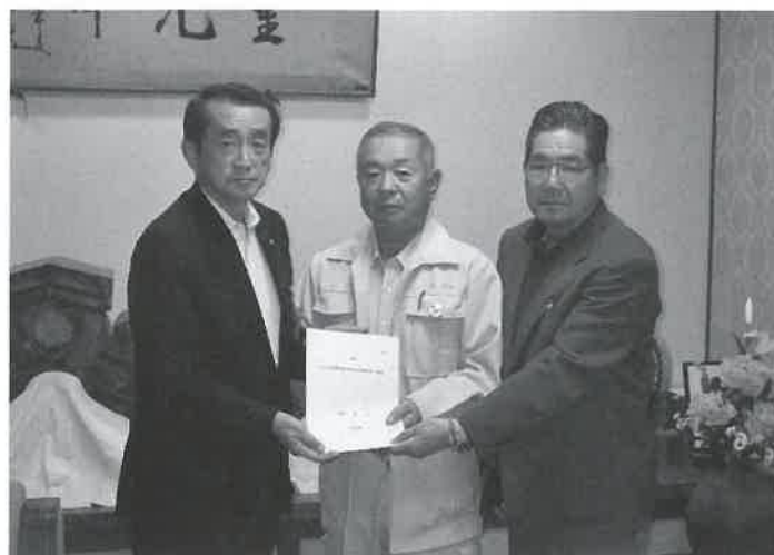
▲町長に答申する小谷会長（中央）と船田会長代理（右）