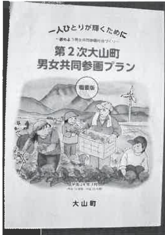
(第二次大山町男女共同参画プラン)

この第一次プランが平成23年度で終了することから、これまでの取り組みの検証や新たな課題をふまえて、計画期間を平成24年度から28年度までの5年