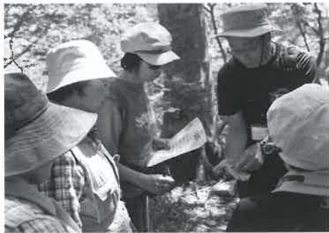
▲「ブナの実って小さいんだ〜」

大工学講座の「大山自然観察会」は、秋にも計画されています。みなさんも、ご一緒にいかがですか。