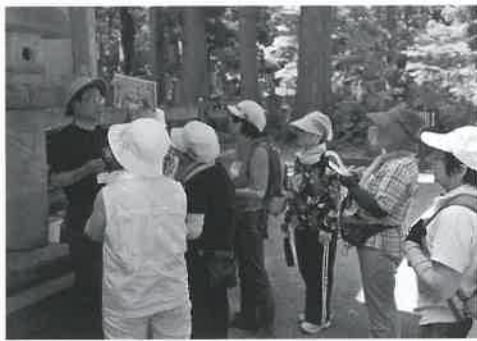
▲「阿弥陀堂」の説明を熱心に聞きました