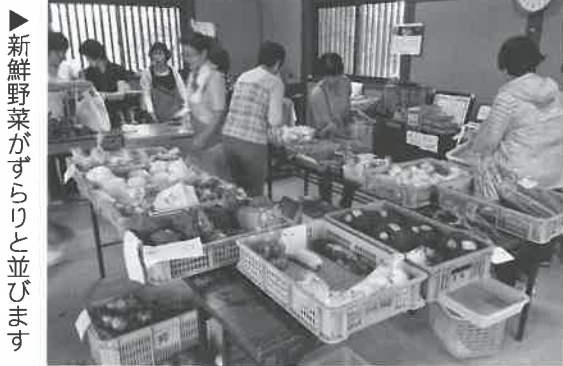
新鮮野菜がずらりと並びます