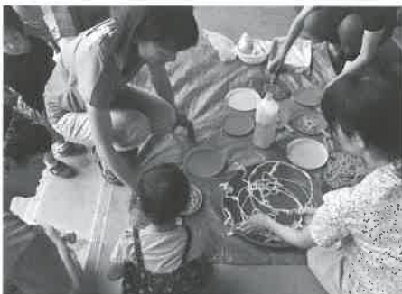
いろいろな形状のワケでシャボン玉を作りました

やらいや逢坂では、今後もさまざまなイベントを企画して取り組んでいきますので、気軽に参加してください。