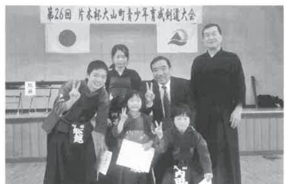
▶片木社長と社長賞受賞の皆さん

また、この大会ならではの「社長賞」も小・中学生の男女にそれぞれ贈られ、今後の精進を誓いました。