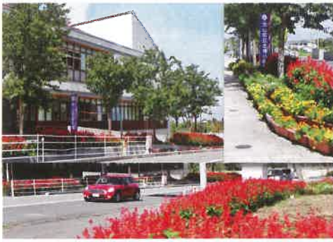
優秀賞 名和小学校