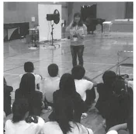
▲真剣に私の話を聞いてくれました(中山小で)

学生時代に演劇部に所属していたことから、中山小学校の学習発表会に、6年生劇の演技指導者(一)として参