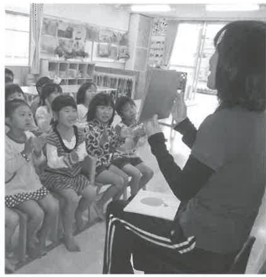
▲みんなで脳トレ「いきいきあそび」

また、保育園では、子どもが満足感を得られるような行事を企画しています。例えば、毎月の誕生パーティーなどの楽しい集いや、魚の水揚げの