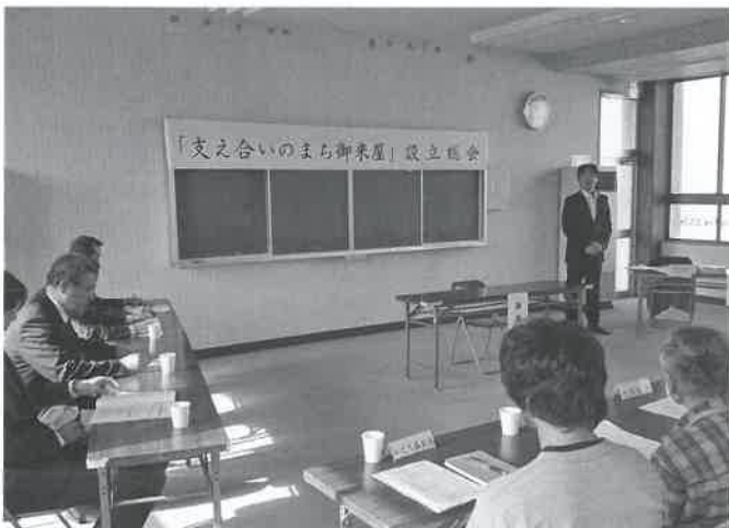
▲11月16日 「支え合いのまち御来屋」