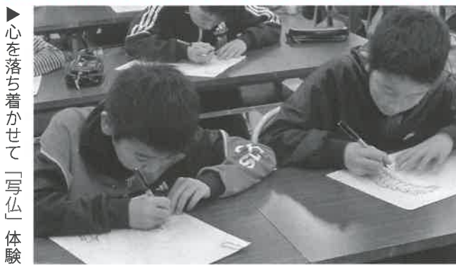
▶心を落ち着かせて「写仏」体験

大山青年の家から学校に通いました。自ら考え行動するよい機会となり、通学合宿の目標に掲げた「時間・ルールを守る」「一人もさみしい思いをしないように協力する」をみんな達成することができました。