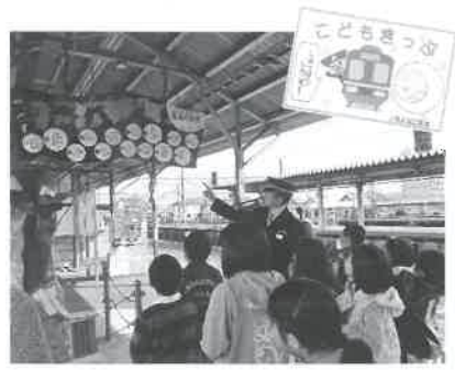
▲「ねずみ男駅」でたくさん妖怪発見!

中山公民館主催の、わくわく体験塾なかやま「米子駅探検隊」が11月10日（月）に行われ、中山小学校1〜4年生の児童21人が参加しました。駅では、古いレールを使った柱や車いすでも移動できるホーム、指令室を見学。どのように列車が時刻どおり動くかを学びました。 「列車はどこで作っていますか」「どうしたら運転士さん