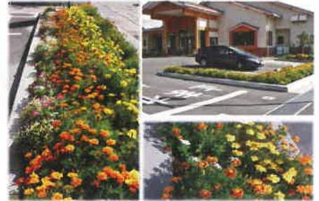
優良賞 中山みどりの森保育園