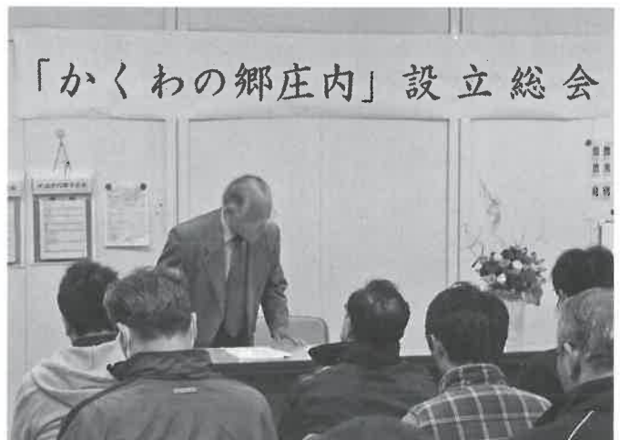
▲11月16日 「かくわの郷庄内」