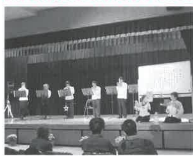
▲オカリナの音色にのって歌いましょう（オカリナサークル銀の笛ポコ）

名和公民館サークル発表会が、11月23日（日）に保健福祉センターなわで開かれ、12