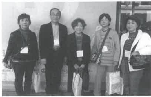
▲学びの多いすばらしい会議でした

・デートDVが7組中1組の割合で起こっている現状に驚き、若いうちからの防止教育がこれからの重要な課題だと痛感した。(デートDV：交際中の若いカップルの間で起こる暴力のこと)