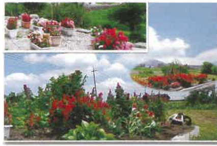
景観賞 上野協議会