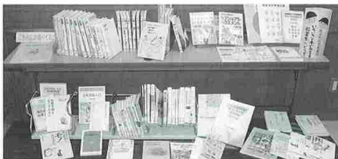
人権・同和問題に関する本の紹介コーナー