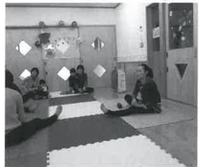
▲ピラティスでリフレッシュ

大切な子育て期を楽しみながら、みんなが子育てをしていけるといいですね。そんな子育ての手助けのできる支援センターでありたいと思います。