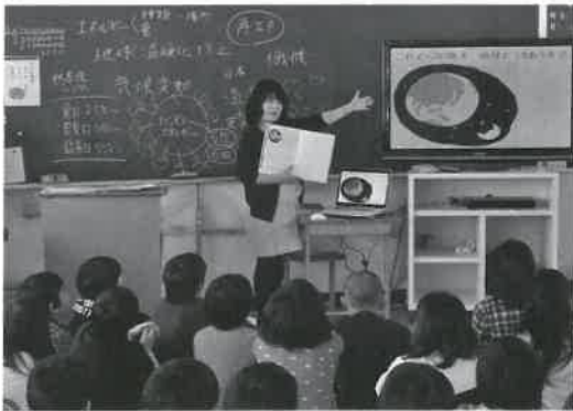
▶サポーターによる出前講座