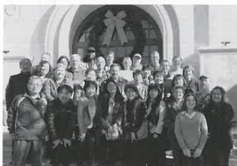
▲ホストファミリーの皆さんと

今回は「合唱団まゆ」のメンバー14名が市役所や学校などを訪問。合唱団としては18年ぶりとなる訪問となり、様々な交流プログラムを通じて両自治体の交流を深めました。