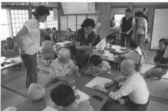
▶ 集落でのタブレット講習会

インターネットの普及で、イベントなど情報を流したり、得たりすることは容易になりましたが、知っている人がそこにいるという安心感や長年暮らしてきた人と人の繋がりにかなうものはありません。