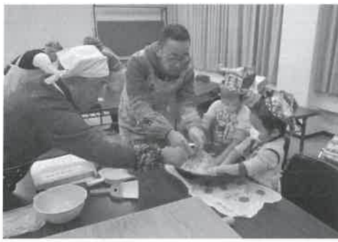
▲そば作りに挑戦中！

大山町産のそば粉を使った「そば打ち講習会」が12月11日に大山農村環境改善センターで行われました。