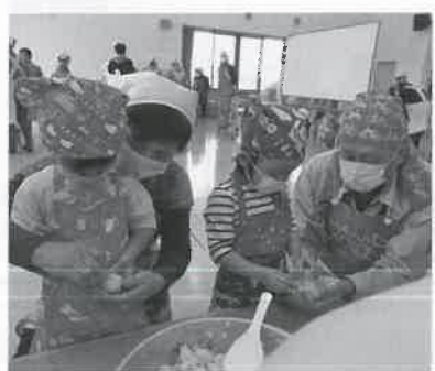
▲祖父母と一緒におにぎり作り

子どもたちがお父さんお母さんとおじいさんおばあさんや温かさを感じられたひとときでした。