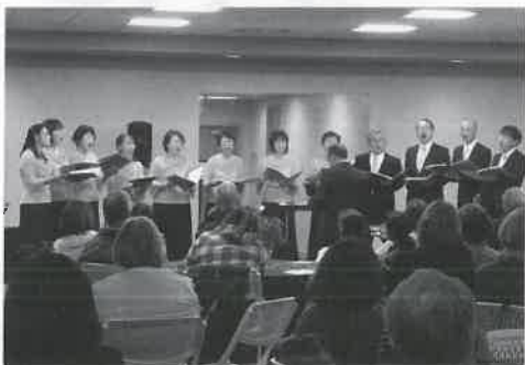
▲フレンドシップコンサート

また、訪問団員は期間中テキサス州の一般家庭にホームステイし、それぞれに、国境を超えた人と人とのふれ合いも体験されました。