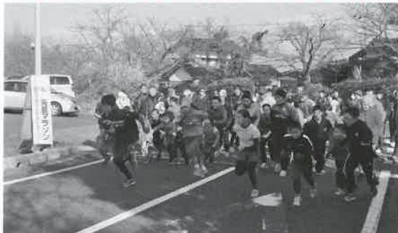
▲元気よくスタート！！

毎年恒例の元旦マラソンが行われました。天候にも恵まれて100人の参加者が集まりました。名和神社に全員でお参りをしたあと、スタート。新春の風を受けながら自分のペースでコースを走り、さわやかな汗を流しました。