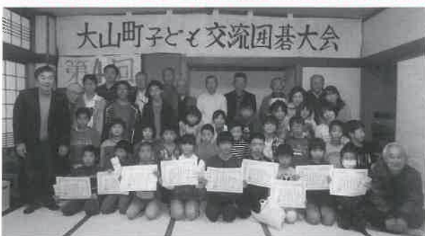
▲入賞者のみなさん

子どもたちは真剣に対局し囲碁を楽しみ、休憩時間には和やかな雰囲気でお交流しました。回を重ねるごとに参加者が増え盛り上がりつつあります。結果は次の通りです。