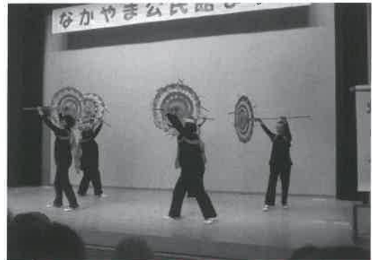
▶ステージ発表の様子