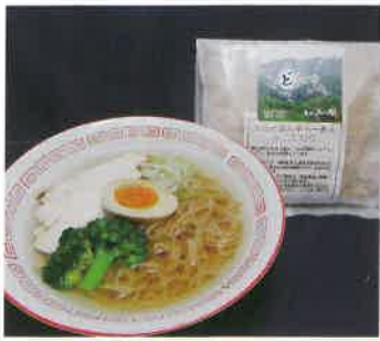
▲道の駅で発売中 (写真は調理例です)

公社では、大山町産小麦を100%使用したオリジナル商品「大山どまん中らーめん」をメイン商品として、大山町の食の魅力をこのエキスポで精一杯PRします。