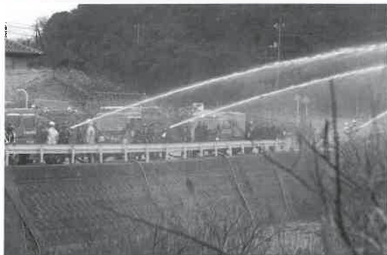
◀名和川での一斉放水

大山町消防団は、住民の皆様の生命や財産を守る縁の下の力持ちとして日々の活動を続けます。