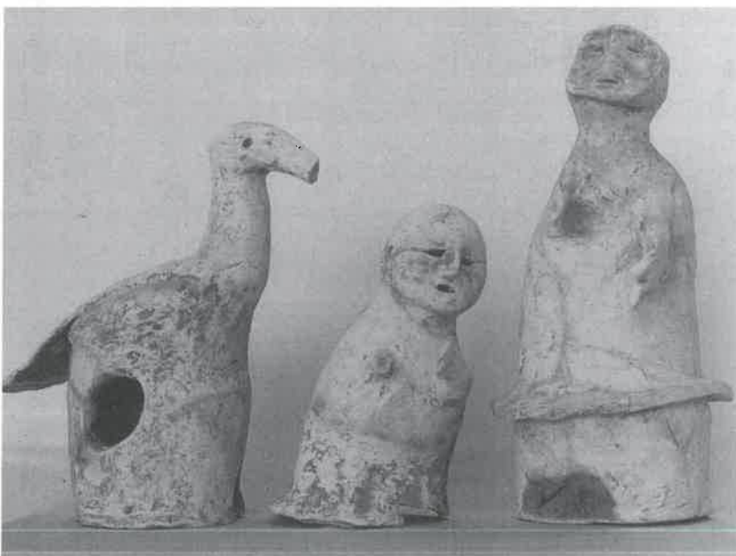
▲ハンボ塚出土埴輪