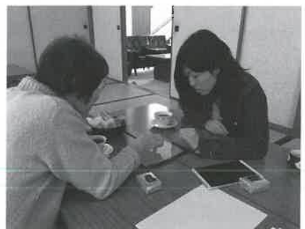
▲ ゆっくり、ていねいに教えます

移住者でもある私にとつて、地元の方々が中心の自主組織や自治会などのコミュニティの存在は本当に大きく心強いものです。まだまだ皆さんに助けってもらうばかりですが、少しずつ恩返しできます。