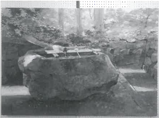
▲題名「大山寺手水舎」