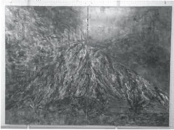
▲題名「いつもの裏側」

今後、作品は大山町内の公民館、学校などで巡回展示します。次回からは、大山公民館で6月から展示予定です。