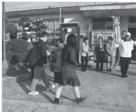
▲マナーアップで、高校生とのふれあいを深めています (大門口駅前)