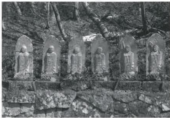
▲大山 石の大鳥居前の六地蔵

及ぶとされ、江戸時代には異界との境とされる往來の辻や墓地の入口などに、六道の衆生を救う「六地蔵」が祀られるようになりました。お地蔵さんは、いつもそばで見守ってくれる身近な存在として信仰されてきました。