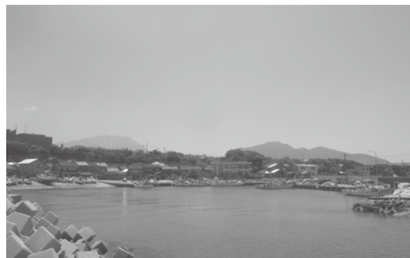
整備を待つ御来屋漁港