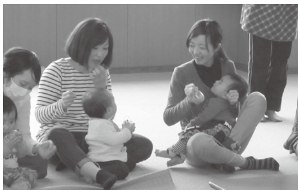
充実してます子育て支援