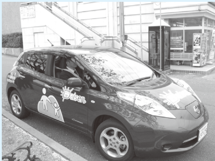
もっと便利に使いたい

バス停の間隔が200m以上あれば対応できるので、区長さんを通じお知らせしている。全体的には、タクシー事業者とのことも勘案し、公共交通会議で検討している。