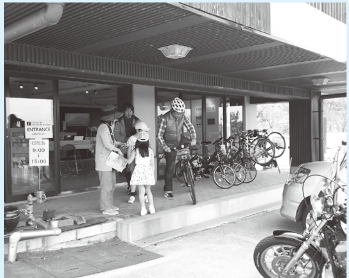
大山の玄関口がリニューアル（旧こもれび館）