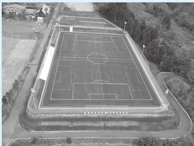
建物（山香荘）の老朽化が課題

再生力が強い洋芝なら解消できるが、地元生産者に配慮し、地元の芝を使っておりやむを得ない面もある。