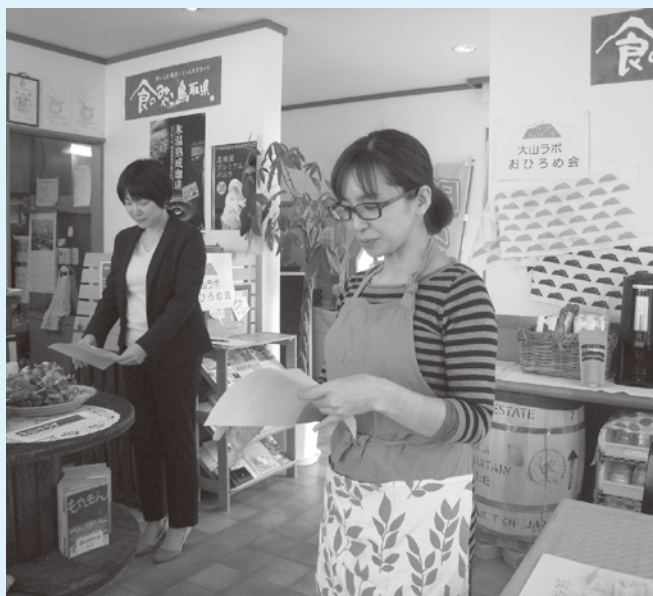
女性の起業支援も積極的に