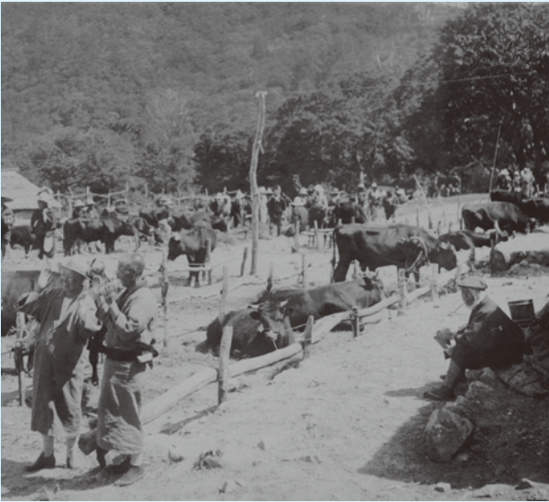
かつての大山牛馬市のにぎわい

日本遺産では、牛馬市の様子をCG（コンピュータグラフィックス）で再現したPR映像の作成など。国立公園満喫プロジェクトと合わせ、県西部で連携し盛り上げていく。