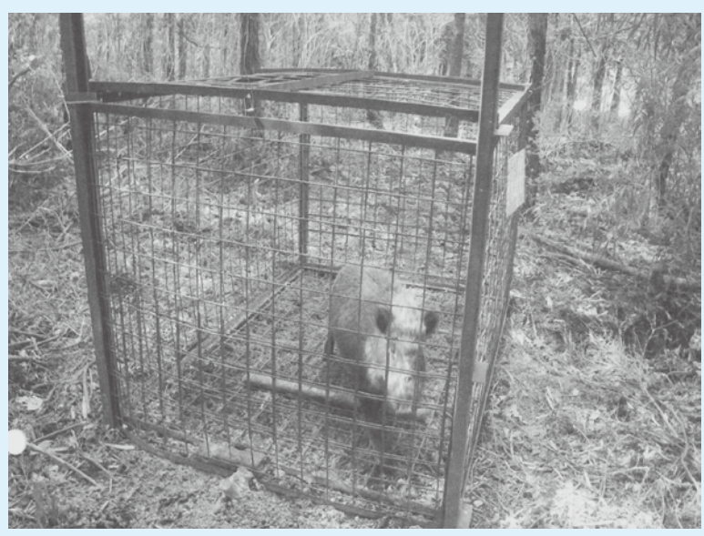
増える有害鳥獣対策に