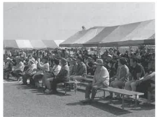
▲大勢の来場者でにぎわう会場