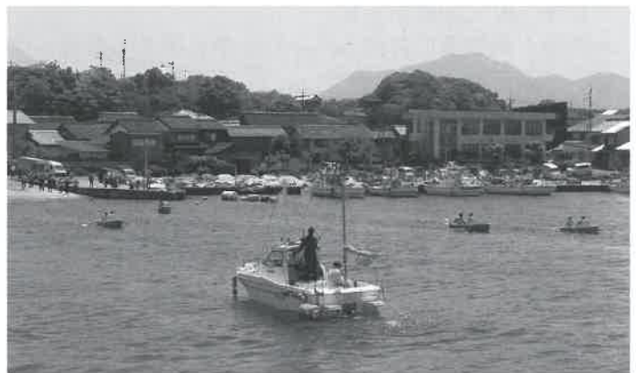
▲ポートこぎに四苦八苦

「みくりやポートフェスティバル & さざえ祭」（主催・みくりやポートフェスティバル実行委員会）が、5月14日に御来屋漁港周辺で行われ、約3,000人の来場者が潮風と海の恵みを感じるイベントを楽しみました。 名和中学校吹奏楽部の演奏や地元スポーツ少年団参加による風船割りゲーム、ENJOY スマイルハッピーズ、ディーバのダンスパフォーマンスで気温の上昇とともに会場は熱気いっぱい。 そして、祭りの名物「さざえごはん」「さざえのつば焼き」も大人気。今年も長蛇の列ができていました。