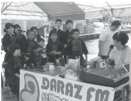
▲イベント生中継中にスポ少の活動をPR（ダラズFM）

結果は常連チームを退け、初出場の「岡水稻生産オペ隊」が優勝の栄冠を手にし、会場を沸かせました。