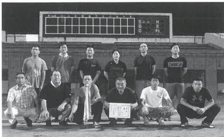
▶優勝した小竹チーム