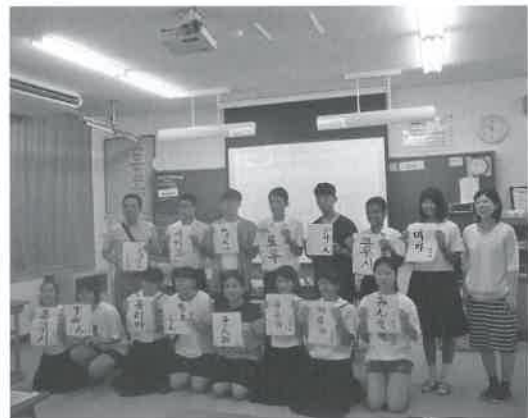
▲大山中学校生徒会と交流