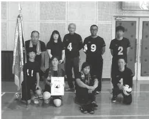
▲優勝した荘田チーム