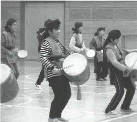
▲大山西小学校でエイサーを披露

滞在中、嘉手納町の児童たちは、大山町内にある「ファーム山下」での酪農体験や大山西小学校児童との交流のほか、境港市の水木しげる記念館などを訪れ、異なる文化を体験しました。中でも、雪遊びやスキーは「生まれて初めて」という児童もいて、新鮮な経験となりました。交流最終日、別れに涙を浮かべる児童の姿も見られ、両町の子どもたちは、今夏の嘉手納町での再会を約束してお別れしました。