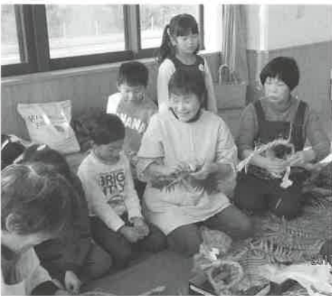
▲もりっこ隊と一緒にしめ縄作り

このように、園児たちは地域の皆さんから愛情をいっぱい受けて、思いやりのある元気な子どもたちに育ち、保育園を巣立っていきます。