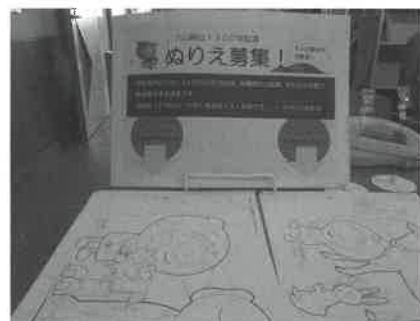
▲「よしみちゃん」のぬり絵を募集します