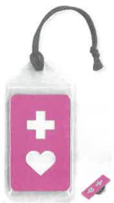
(ストラップ) (ピンバッジ)

義足や人工関節を使用している方、内部障がいや難病の方、妊娠初期の方など、援助や配慮を必要としていることを知らせることで、援助が得やすくなるよう、「ヘルプマーク」を作成し、普及に取り組んでいます。