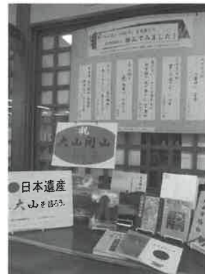
▶「祝 大山開山1300年」のコーナー

ふるさとの秀峰大山をさらに探究していただけるよう関連本は常時展示しています。1300年節目の年に、ぜひご参加ください。詳しくは図書館で！