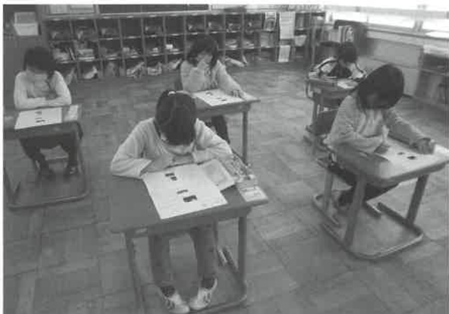
▶大山検定に挑む児童

教育委員会とも連携し、今後は、町内の小・中学校での実施や町民の皆さんにも受検してもらえるよう計画しています。