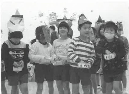
▲悪い鬼をやっつけるぞ！