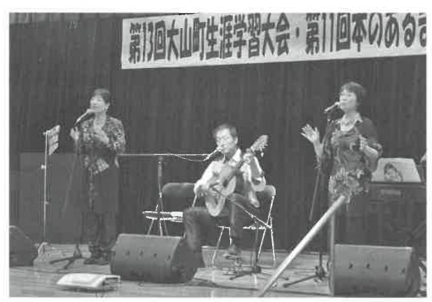
▲心が温まったフリーダムの平和コンサート