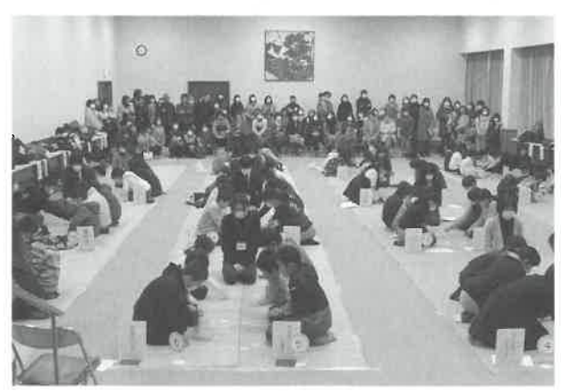
▲今年は30チームが出場した百人一首大会