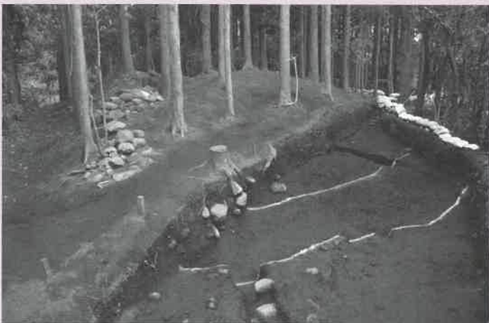
▶向原4号墳完掘状況