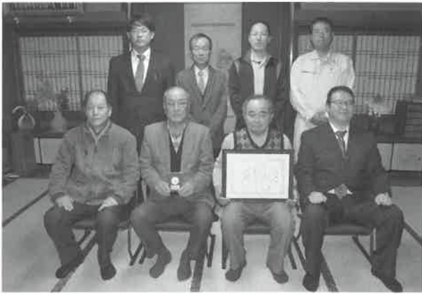
▲パトロール隊のみなさん