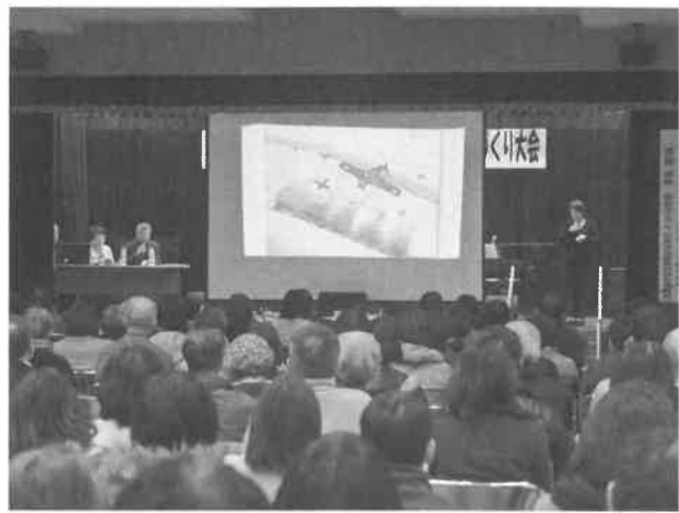
▶紙芝居「ガキ大将の特攻物語」上演

また、昼食として会場内で学校給食を有料で提供し、約200人が「地産池消の給食」を味わいました。