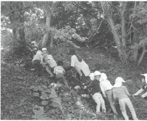
▲ヤッホー冒険山でロープ登り

園庭の東側の裏山に、地域の方の協力により、ヤッホー冒険山ができました。春はタケノコやワラビ採り、秋は栗拾いをし、採れたものについては、給食でも食べます。また木に登ったり、四季折々の自然の中で走り回って遊ぶ子どもたち。冒険山から「ヤッホー」と呼びかけると、園庭で遊ぶ子どもたちも手を振って応えてくれます。保護者による手作り