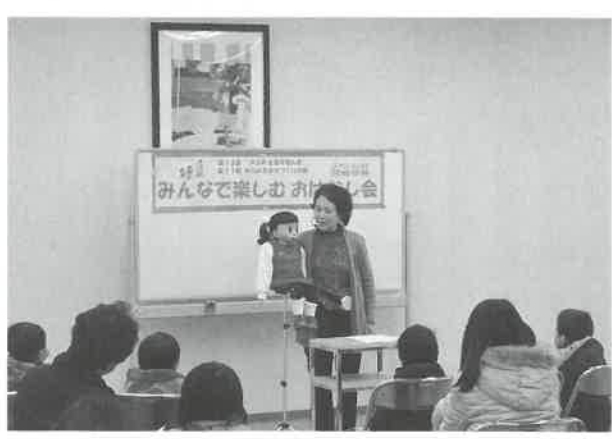
▲人形がしゃべった!? (みんなで楽しむおはなし会より)