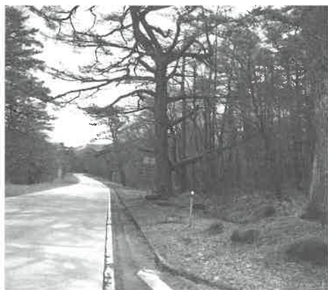
▲大山並木松 (町指定)

分けの茶屋跡は、尾高道と丸山道 の合流点で丸山から一里、赤松から 一里、そして博労座からも一里とい う地点にあります。江戸時代中期以 降、この地に小屋掛けの茶店が立 ち、米子・丸山両方面の「分かれ」 に立つ「茶屋」ということで「分け の茶屋」と呼ばれるようになったよ うで、当時の参詣者にとって大切な 休憩所でした。分けの茶屋は、寛政