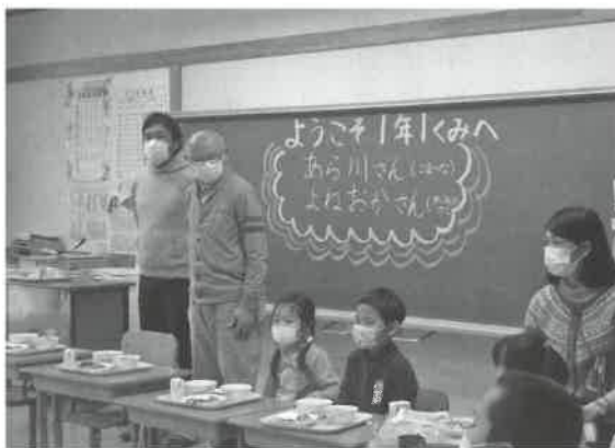
▲おいしい野菜を作ります。しっかり食べてね！

全国学校給食週間中の1月24日・30日の両日、名和小学校と大山小学校で「交流給食」が行われました。大山恵みの里公社では、町内学校給食の食材を日々、給食センター等に配送しています。給食用に野菜等を出荷している生産者と公社職員（24日は13名、30日は3名）が学校に招かれ、児童の皆さんと地元食材をたっぷり使った給食をいただきました。食事中、児童から「農家のやりがいは何ですか」「一番大変な仕事は？」など質問の声があがり、参加者は子どもにもわかりやすいよう一生懸命答えました。子どもたちは、美味しい給食を食べられる背景には、生産者のもとより、さまざまな人たちが関わっていることを感じとってくれました。