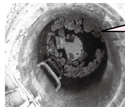
マンホールに油が詰まりました。