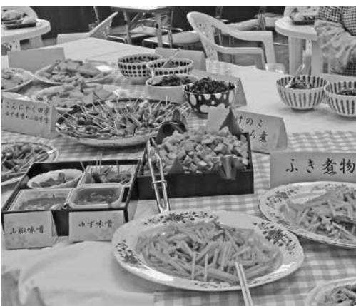
▲多彩な品揃えの山菜料理

収穫した山菜を用いた田楽・白和え・ナムル・天ぷら・佃煮・煮物・炊き込みご飯・吸い物・デザートなどが多彩な品揃えに、総勢60名の参加者が自然の恵みに舌鼓を打ちました。