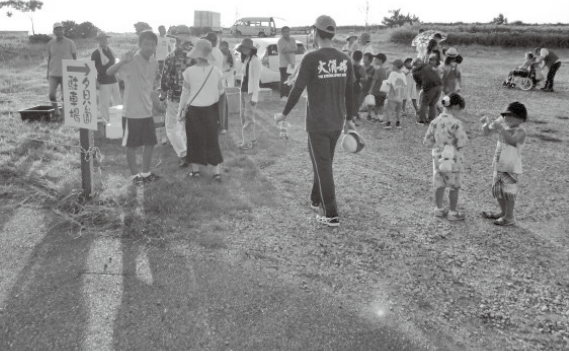
▲サンセットウォーク

空き家対策として、米子高専と連携し、空き家探しと活用について取り組みを行います。また、「御来屋夕日公園」の整備を行います。