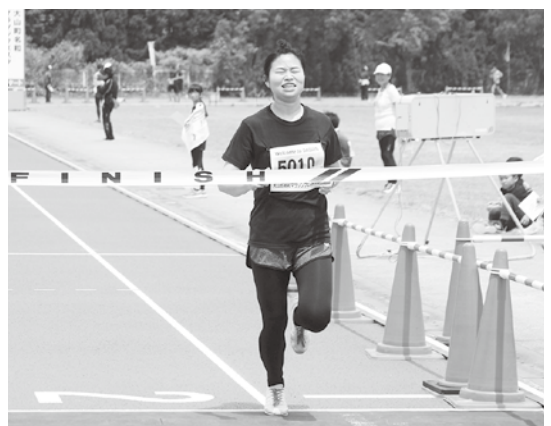
▲1位でゴールする氏さん（ハーフ女子）