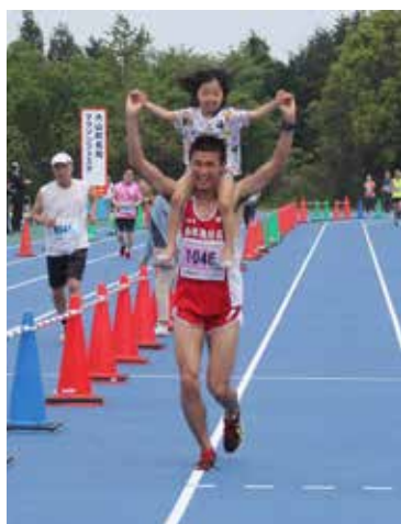
▶お父さんと一緒にゴール!