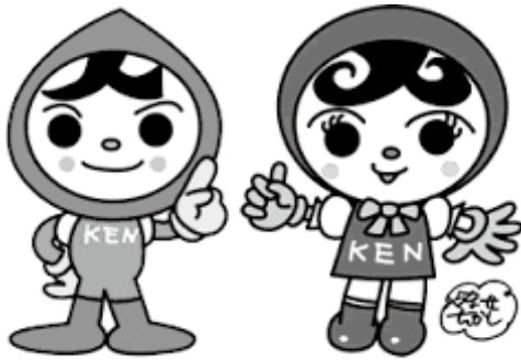
人権イメージキャラクター 人KENまもる君・人KENあゆみちゃん