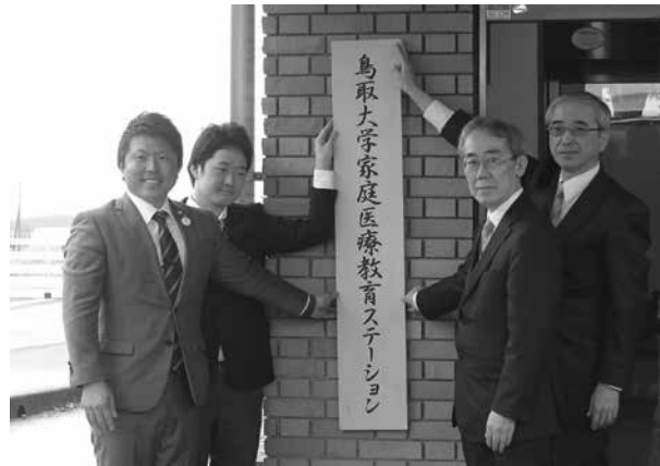
▲大山診療所看板上掲式