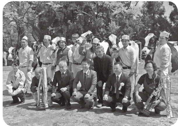
◀乳牛共進会の会場で

共進会での審査は、乳牛の体格や乳房の発達具合など、細かな項目によって順位付けがされますが、素人目にはなかなか違いが分かりま