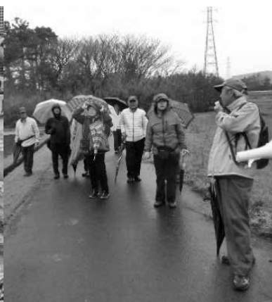
▲史跡めぐり（荘田地区）