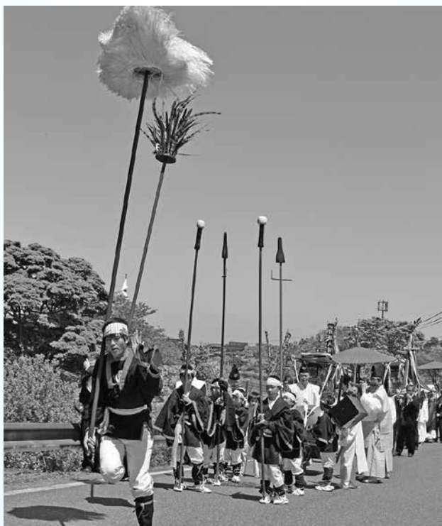
▲子どもたちが活躍する御幸行列

行列の花形、「烏毛・白毛」の華麗な舞いを交えながら、社旗を筆頭に3基の神輿を守りつつ、神楽団や伝統の装束を身にまとった氏子たちが、本殿から御幸場まで練り歩きました。御幸場では、神事のほか氏子の乙女たちが平和と安泰を願い、「浦安の舞」を奉納しました。