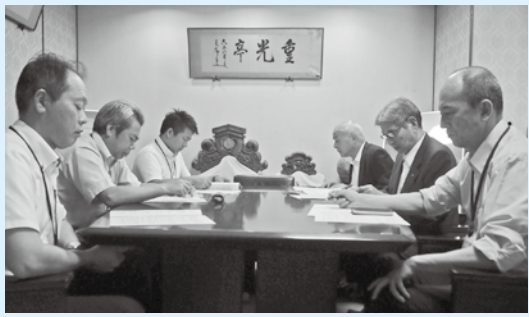
監査委員からの報告を受ける町執行部