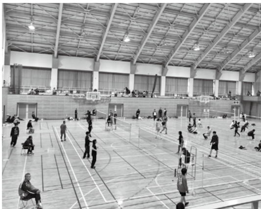
▲たくさんの参加者でにぎわいました