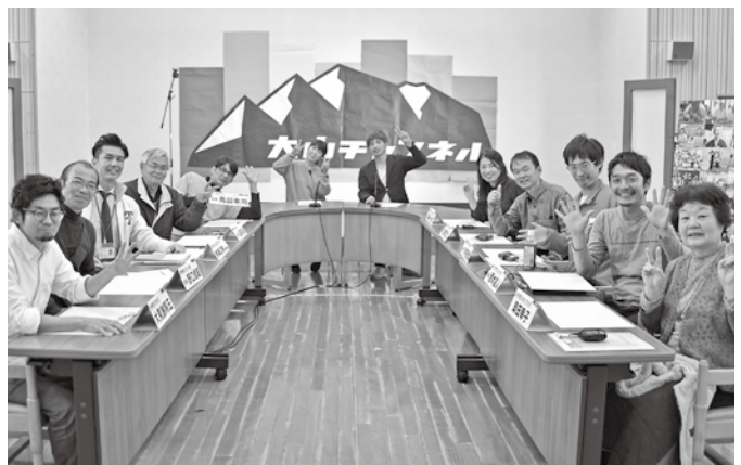
▲トークセッションの様子は、大山チャンネルの番組でも紹介

飯が食べられるようなアットホームな地域』。頼ったり頼られたり、何でも言える地域になれば安心して暮らせる。世代間交流が生まれれば、様々なことを教えてあげることができ、子どもたちも何かしたいときには大人の力が必要で、年代をつなぐ重要性を感じる。