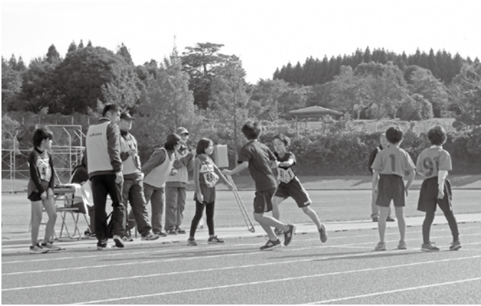
▲チームの思いをタスキにこめて

当日は一般から小中学生まで10チームの参加があり、熱戦を繰り広げました。中学校男子、一般男子でそれぞれ区間新記録も出るなど、素晴らしい大会となりました。 大会結果は次のとおりです。