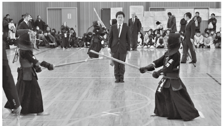
▲熱い試合が繰り広げられました