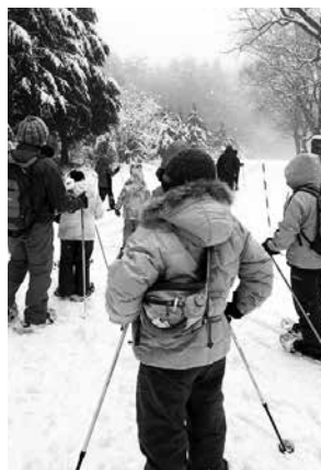
▲昨年の「スノーウォーク」の様子