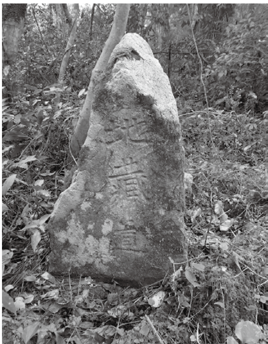
▲地藏道と記された道標