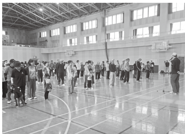
▲多くの人が集まりました

この大会は、光徳地区の皆さんが一堂に会するイベントです。今後も趣向を凝らしながら取り組みを継続して、更に多くの人に参加していただけるような大会を考えていきます。