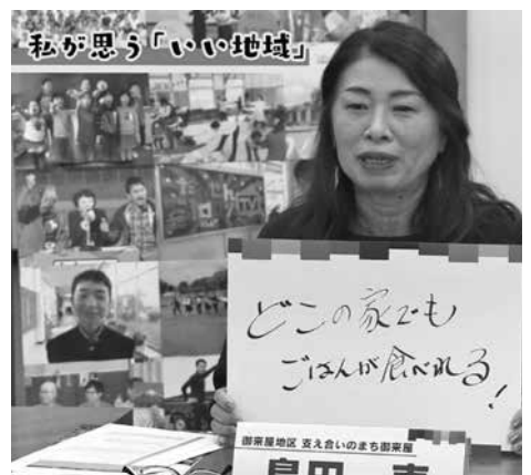
▲何でも言い合えるアットホームな地域に

たいし、もっとたくさんの人に浸透させたい。町内すべてを町民みんなで輝かせましょう。