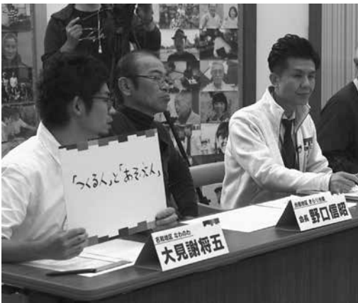
▲いい地域ってどんな地域？

ンを実施し、若いお母さんが地区内外からたくさん来た。若い人の興味を引く取り組みが大切。