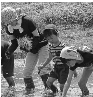
▲もりっこ隊や小学生らと一緒に田植えをする園児たち

地域のみなさんの協力やふれ合い、交流など、恵まれた環境の下で、子どもたちは、貴重な体験をしながら育っています。