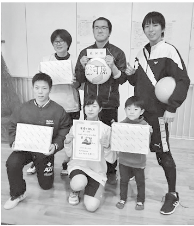
◀優勝の松河原チームの皆さん