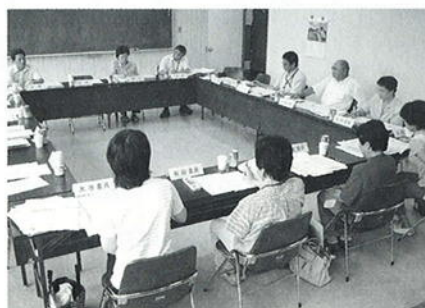
6月22日におこなわれた第1回委員会

今後は、保育所などの視察や検討会議を行い、検討の結果は、9月中旬に『幼児教育振興計画』としてまとめる予定です。