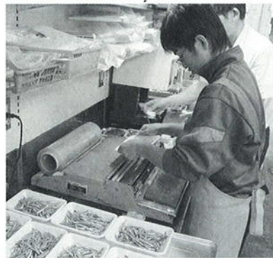
昨年の職場体験の様子 (中山中学校生徒)

7月3日(月)～7月7日(金)の5日間、中山・名和・大山中学校の2年生が町内の事業所で職場体験学習を行います。 この学習により自己の理解を深め、望ましい勤労観・職業観を身につけるだけでなく、社会的なルールやマナーを体得し、地域への愛着や誇りを持つことができるようになることが期待されます。