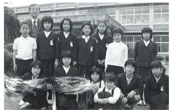
心を込めて折った千羽鶴を手にする中山小学校の児童

2日目の夜は、「第60回大山夏山開き祭」で、たいまつ行列に参加。訪問団の方は、参加者の多さに驚き、たいまつのはの多さに感激されていました。秋には襄陽郡のまつたけ祭りにあわせ、町長が訪韓する予定です。