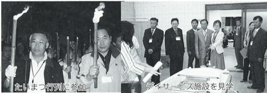
デイサービス施設を見学