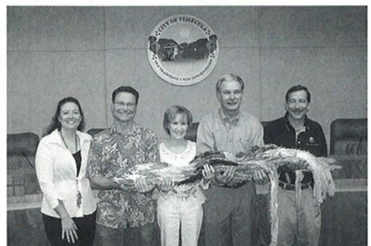
千羽鶴を受け取るテメキュラ市職員

習字や絵の交換などが行われ、このような交流を通して、友情がいつそう深まっています。