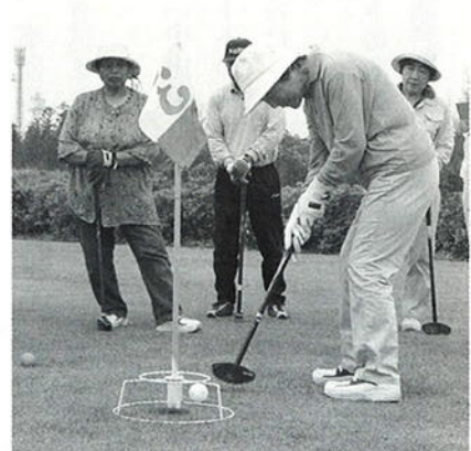
わきあいあいとプレーします

6月8日(木)ふるさとフォーラムなかやまの四季彩園で「第5回なかやま温泉杯グラウンド・ゴルフ大会」が行われ、町内外から369人の愛好者が集い、さわやかな汗を流しました。