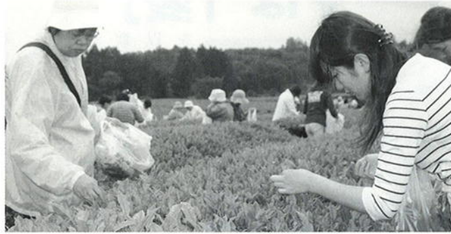
無農薬のお茶畑でお茶摘み体験