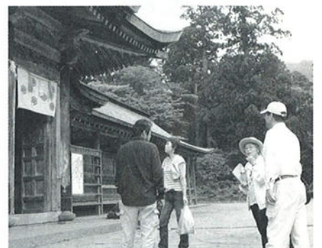
大神山神社などを案内しました

今後、ボランティアガイドの 皆さんの取り組みが充実、発展 し、「おもてなしの心」が観光 客に浸透していくことに期待を しています。