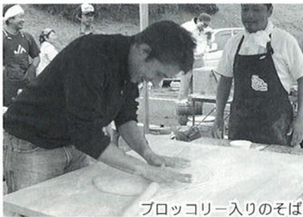
ブロッコリー入りのそば