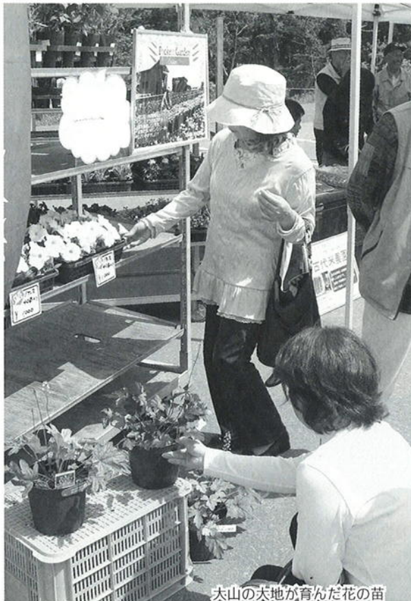
太山の大地が育んだ花の苗