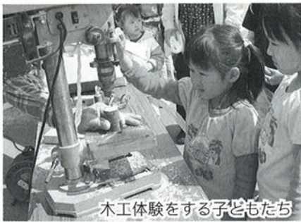
木工体験をする子どもたち